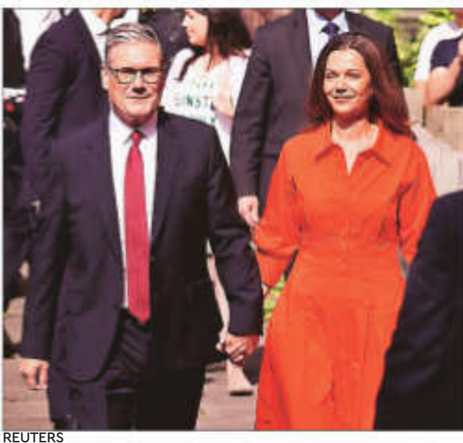
(Left) Britain's opposition Labour Party leader Keir Starmer and his wife Victoria Starmer walk outside a polling station in London

"They will do lasting damage to our country and our economy - just like they did the last time they were in power," Sunak said on Thursday. "Don't let that happen."