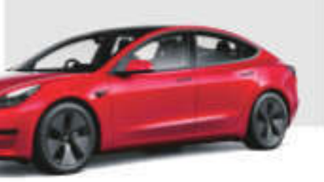
Beijing said then it would take "all necessary measures" to safeguard China's interests.

TESLA'S BEST-SELLING Model Y was included in a list of electric and plug-in hybrid models that a local government in China can purchase as a service car, according to the official Chinese media outlet the Paper on Thursday. It was the first time Tesla's cars have been made eligible for government purchases in China.