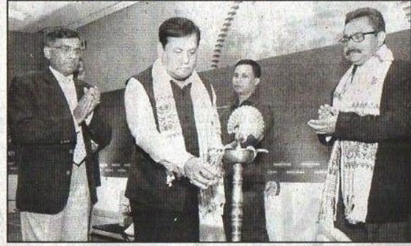
दीप जलाकर मेले का शुभारंभ करते मुख्यमंत्री सर्वानंद सोनोवाल।

मध्यम उपक्रमों के प्रतिनिधियों को भी सम्मानित किया जो एनएसई के मंचों पर सूचीबद्ध हैं। इस मौके पर असम के मुख्यमंत्री सर्वानंद सोनोवाल ने कहा कि मुझे बहुत खुशी हो रही है कि नेशनल स्टॉक एक्सचेंज जो इन्डिविडुअल पूंजी बाजार में स्थापित नाम है और निवेशक तथा पूंजी बाजार के बीच प्रभावशाली अंतरफलक है, गुवाहाटी में इस पहले निवेशक मेले का आयोजन कर रहा है। मुझे भरोसा है कि एनएसई निवेशक मेला इस पू-भाग के निवेशकों के लिए सूचना के चैनल का काम करेगा और वित्तीय ज्ञान मुहैया कराएगा। उन्होंने यह भी कहा कि हमे उम्मीद है कि एनएसई राज्य के अन्य शहरों में भी इस प्रकार के निवेशक मेले का आयोजन करेगा। वहीं दूसरी ओर एनएसई के प्रबंध निदेशक एवं मुख्य कार्यकारी विक्रम लिमये ने कहा कि इस निवेश मेले के आयोजन का मूल लक्ष्य है स्थानीय लघु एवं मध्यम उपक्रमों को एक्सचेंज में सूचीबद्धता के