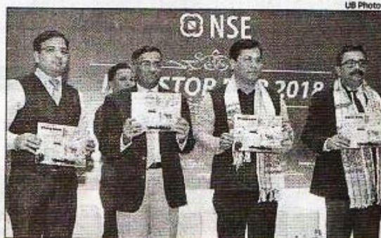
Chief minister Sarbananda Sonowal at the inaugural programme of the NSE Investor Fair 2018 in Guwahati on Saturday

The CM added, "Assam has a unique advantage of being situated at a strategic geographic location, making it an ideal destination for running business in the entire southeast Asian region. Our government is committed to encouraging entrepreneurs for venturing out into this huge market in ASEAN countries and bring economic transformation in this part of the co-