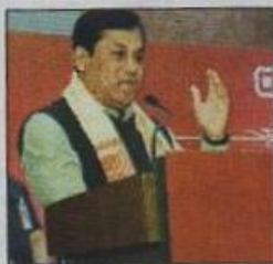
Chief minister Sarbananda Sonowal addresses the gathering in Guwahati on Saturday.

Guwahati: Small and medium enterprises (SMEs) of the region can look forward to getting enlisted on NSE Emerge platform of the National Stock Exchange of India (NSE).