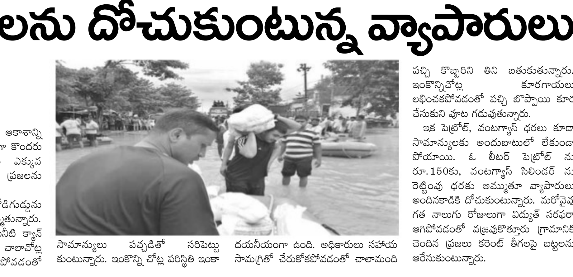
సామాన్యులు పచ్చడితో సరిపెట్టు కుంటున్నారు. ఇంకొన్ని చోట్ల పరిస్థితి ఇంకా దయనీయంగా ఉంది. అధికారులు సహాయ సామగ్రితో చేరుకోవడంతో చాలామంది అరేసుకుంటున్నారు.

శ్రీకాకుళం: శ్రీకాకుళం జిల్లాపై విరుచుకుపడ్డ తిట్ల తుపానుతో పంటలు తీవ్రంగా దెబ్బతిన్న సంగతి తెలిసిందే. కొబ్బరి, జీడి చెట్లు నెలకొరగడంతో రైతలు కన్నీరుమున్నీరుగా విలపిస్తున్నారు. ఇక జిల్లాలోని సామాన్యులు, పేదల పరిస్థితిని పరిశీలించే దృషిని మార్చింది. చాలాచోట్ల తాగేందుకు స్వచ్ఛమైన నీరు, తినేందుకు ఆహారం లభించక అల్లాడిపోతున్నారని, తిట్ల ప్రభావంతో నిత్యావసరాల ధరలు కూడా ఆకాశాన్ని అంటుతున్నాయి. ఈ సందర్భంగా కొందరు వ్యాపారులు నిత్యావసరాలను ఎక్కువ ధరలకు అమ్ముతూ ప్రజలను దోచుకుంటున్నారని, కేవలం రూ.5 ఉన్న కోడిగుడ్డును వ్యాపారులు రూ.10కు అమ్ముతున్నారు. అలాగే 25 లీటర్లు ఉన్న తాగునీటి క్యాన్ల ఏకంగా రూ.50కు చేరుకుంది. చాలాచోట్ల కూరగాయలు లభించకపోవడంతో