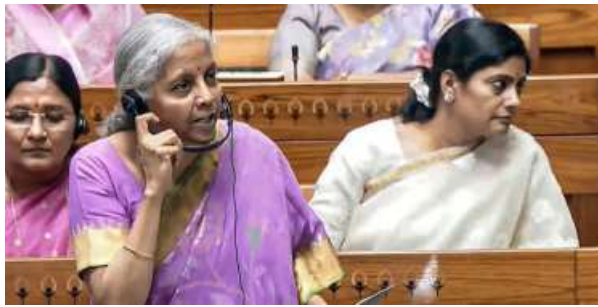
REFORMS ON THE CARDS. Finance Minister Nirmala Sitharaman during the monsoon session of Parliament in New Delhi on Friday

The FM told MPs that all the 285 recommendations of the Select Committee had been accepted by the government. Explaining why the Bill was going to be re-introduced, the FM said in a statement circulated among MPs: "Suggestions have also been received from other sources which are required to be incorporated to convey the correct legislative meaning. There are corrections in the nature of drafting, alignment of phrases, consequential changes and