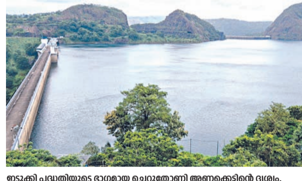
ഇടുക്കി പദ്ധതിയുടെ ഭാഗമായ ചെറുതോണി അണക്കെട്ടിന്റെ ദൃശ്യം.