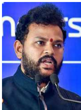
Civil Aviation Minister Ram Mohan Naidu

The Centre will hold monthly reviews of the operations of domestic airlines to make the civil aviation sector more responsive to the needs of passengers and address safety concerns, sources told businessline .