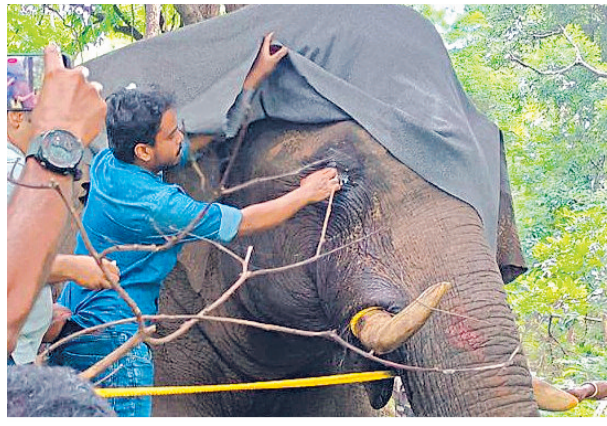
കാഴ്ചക്കുറവുള്ള പി.ടി അഞ്ചാമൻ കാട്ടാനയ്ക്കു ചികിത്സ നൽകുന്ന വിവിധ ദൃശ്യങ്ങൾ.