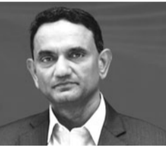
बीते वित्त वर्ष में टीसीएस के मुख्य कार्य अधिकारी का पैकेज 4.6 फीसदी बढ़ा

सर्विसेज (टीसीएस) के मुख्य कार्य अधिकारी के कृत्तिवासन का वेतन पैकेज बीते वित्त वर्ष 2025 में 4.6 फीसदी बढ़कर 26.5 करोड़ रुपये रहा। इससे पिछले वित्त वर्ष 2024 में उनका वेतन पैकेज 25.35 करोड़ रुपये था। कंपनी की सालाना रिपोर्ट से यह जानकारी मिली है। कंपनी के साथ दो साल पूरा करने वाले कृत्तिवासन का वेतन 1.27 करोड़ रुपये से बढ़कर साल 2025 में 1.39 करोड़ रुपये हो गया। इसके अलावा उन्हें लाभ, भत्तों और सुविधाओं के रूप में 2.12 करोड़ रुपये और कर्मोशन के रूप में 23 करोड़ रुपये मिले। कर्मचारियों के औसत वेतन सा उनका वेतन अनुपात 329.8 है। कंपनी के मुख्य कार्य अधिकारी की वेतन वृद्धि पिछले साल टीसीएस द्वारा अपने कर्मचारियों को दी गई वेतन वृद्धि के करीब-करीब अनुरूप है। सालाना रिपोर्ट के