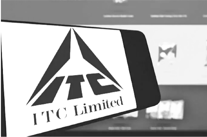
शेयर बिक्री के बाद बीएटी की हिस्सेदारी 25 प्रतिशत की सीमा से नीचे आ गई है और यह कंपनी के निदेशक मंडल में बदलाव का भी संकेत है

इस कदम से बीएटी की हिस्सेदारी 25 प्रतिशत की सीमा से नीचे आ गई है और यह कंपनी के निदेशक मंडल में बदलाव का भी संकेत है। 25 प्रतिशत की हिस्सेदारी से शेयरधारकों को प्रस्तावों को प्रभावित करने या विरोध करने की अनुमति मिलती है। खास तौर पर उन