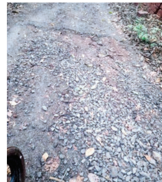
खोतीगाव वन्यजीव अभयारण्यात वसलेल्या आवळी या वस्तीतील रस्ता.