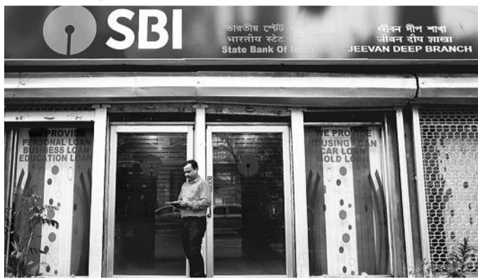
Results impact (SBI share price in ₹)

The management guided for credit growth of 13-15 per cent going forward and expects to sustain domestic NIM above 3 per cent in 2026-27 (FY27), with return on assets (RoA) staying above 1 per cent. The bank maintained its credit cost guidance at 50 basis points (bps).