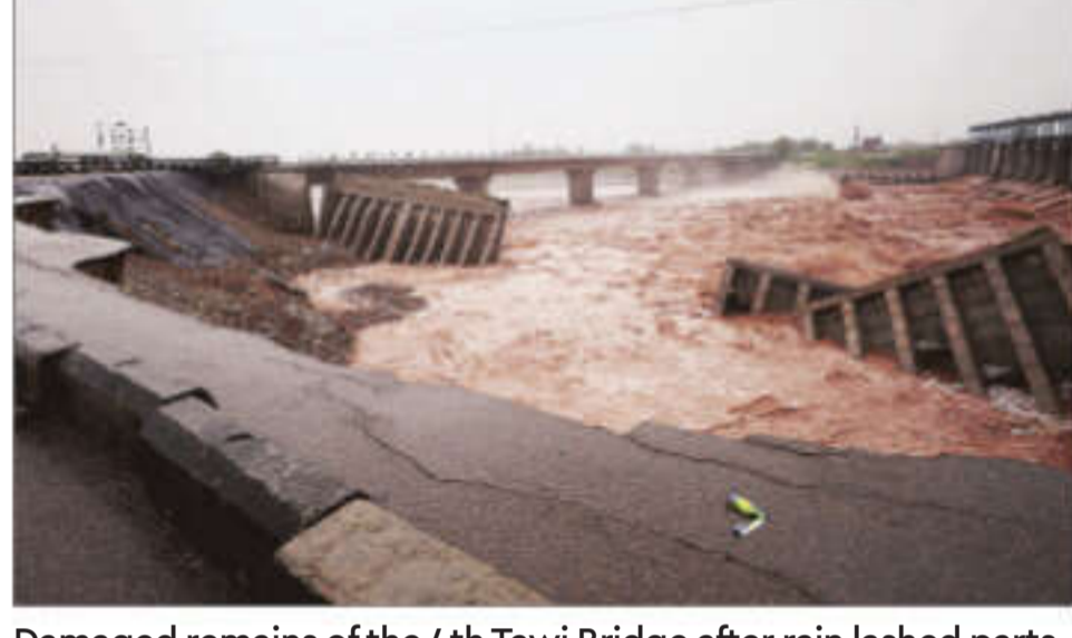
Damaged remains of the 4th Tawi Bridge after rain lashed parts of the city in Jammu on Wednesday

FLOODING ACROSS NORTHERN India killed at least five people on Wednesday, officials said, with more than 10,000 people evacuated from the river banks in capital Delhi. The monsoon season in India has been particularly intense this year, killing at least 130 people in August alone in north India, wiping out villages and destroying infrastructure.