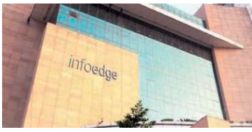
Below the benchmark

The Street will thus track progress on the operational front, especially any recovery in the recruitment business. Recruitment billings in the fourth quarter (Jan-