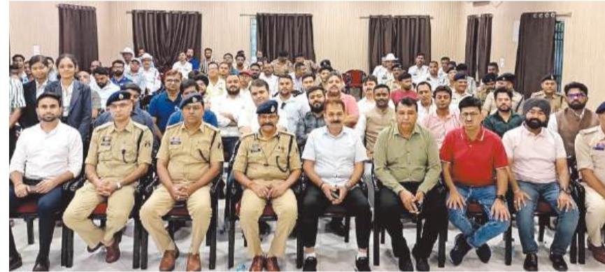
स्टंटबाजी की हो रही लगातार घटना