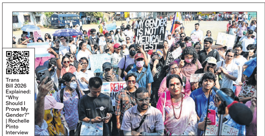
'Identity under threat' Members of the LGBTQ+ community gathered at Azad Maidan on Wednesday to protest against the Transgender Bill, alleging it is exclusionary and undermines their right to self-identification — Full report: freepressjournal.in