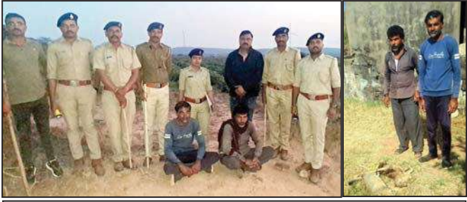
માનવતાને શર્મશાર કરતી ઘટના ઉજ્જગર થતાં કચ્છભરમાં ફેલાઈ અરેરાટી : પાકના રક્ષણ માટે ખેતરની વાડમાં વીજ પ્રવાહ કરી દેવાયો હતો વહેતો : વીજ શોક લાગતા અલભ્ય અને રક્ષિત જંગલી બિલાડી, શિયાળ, નિલાગાય સહિતના પશુઓ બે માસમાં મોતને ભેટ્યા : વન વિભાગ દ્વારા બે આરોપીઓની ધરપકડ બાદ જામીન પર છુટકારો

ભુજ : સરહદી કચ્છ જિલ્લામાં જીવદયાની પ્રવૃત્તિઓ અવિરત ચાલતી રહે છે. અબોલ જીવો અને પશુ- પક્ષીઓ પ્રત્યે કચ્છવાસીઓમાં અપાર અનુકંપા જોવા મળે છે પણ કેટલાક લોકો પોદતાના અંગત સ્વાર્થ માટે અબોલજીવોનો ભોગ લેતા પણ અટકાતા નથી. આવો જ એક કિસ્સો નખપ્રાણના સાંગનારા ગામમાં ઉજ્જગર થયો છે. સાંગનારાના ખેડૂતોએ પોતાના ખેતરમાં પાકના રક્ષણ માટે ખેતરને ફરતે કરેલી વાડમાં વીજ પ્રવાહ વહેતો કરી દેતાં છેલ્લા બે માસ જેટલા સમયગાળામાં ૨૧ જેટલા પશુઓના મોત થયા હતા. આ બનાવ પ્રકાશમાં આવતાં કચ્છના જીવદયાપ્રેમીઓમાં ભારે અરેરાટી ફેલાઈ છે. પોતાના અંગત સ્વાર્થ માટે અબોલજીવોનો ભોગ લેનાર સામે લોકો ફિટકાર વરસાવી રહ્યા છે. બનાવની જાણ થતાં વનતંત્ર પણ હરકતમાં આવ્યું છે અને પોલીસ તંત્ર સાથે સંકલનમાં રહી દરરોડે પાટ્યો હતો. આ ગુનામાં બે આરોપીઓની ધરપકડ કરી કોર્ટમાં રજુ કરાયા હતા. અદાલતે