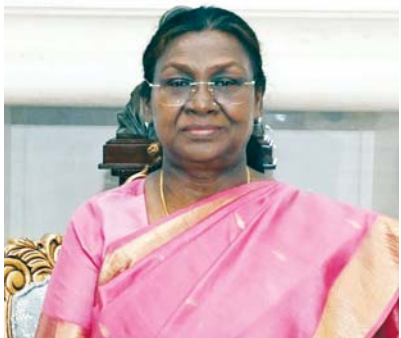
राष्ट्रपति द्रौपदी मुर्मू

इस अवसर पर राष्ट्रपति मुर्मू ने अपने संबोधन में कहा, 'मुझे सिक्किम पुलिस को विशिष्ट सेवा के लिए राष्ट्रपति पुलिस पदक प्रदान करते हुए अत्यंत प्रसन्नता हो रही है। यह सम्मान सिक्किम पुलिस के सभी सदस्यों के लिए गर्व का विषय है।