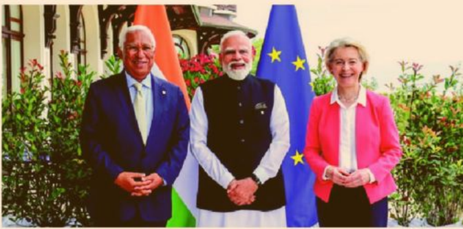
फ्रांस के एवियां-ले-बैन में प्रधानमंत्री नरेंद्र मोदी के साथ यूरोपीय आयोग की अध्यक्ष उर्सुला वॉन डेर लेयेन (दाएं) और यूरोपीय परिषद के अध्यक्ष एंटोनियो कोस्टा