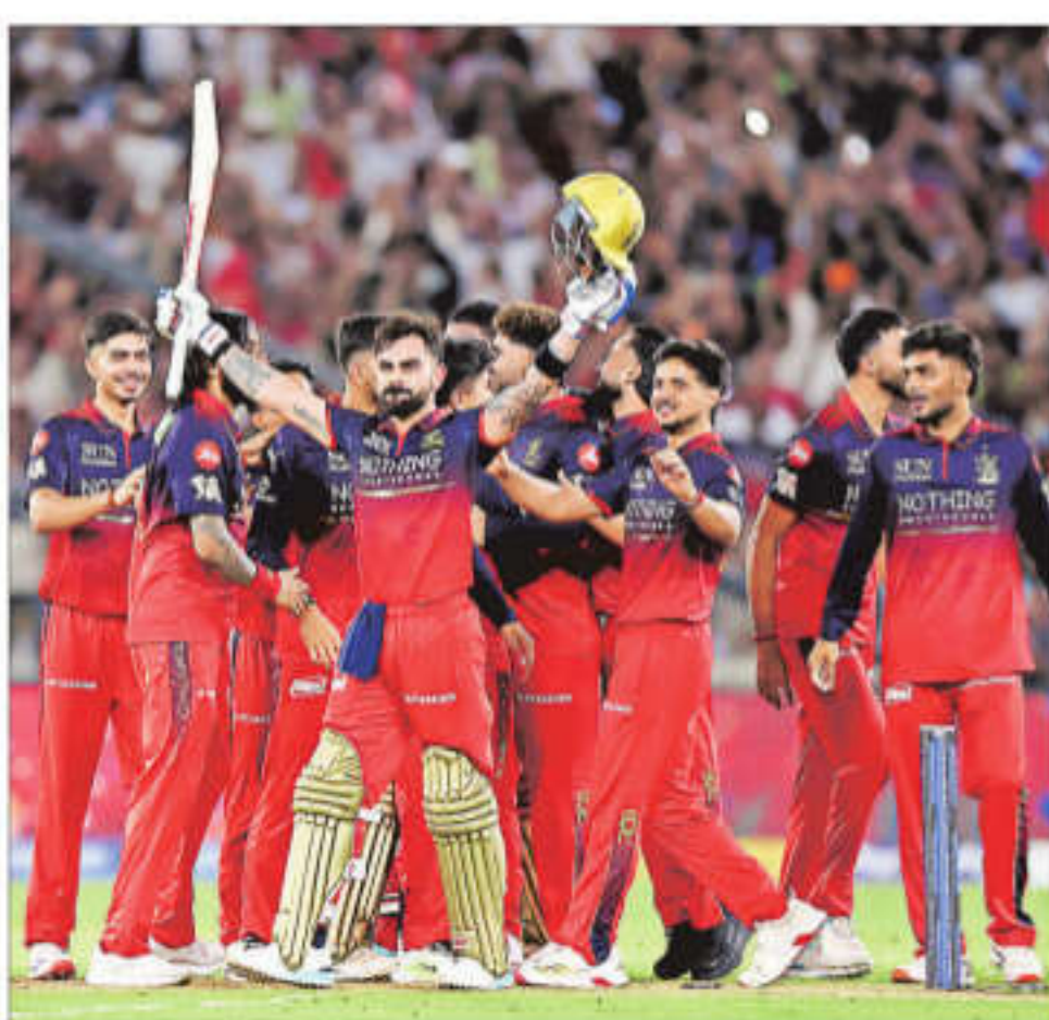
Royal Challengers Bengaluru's Virat Kohli celebrates with teammates after their win in the IPL final match against Gujarat Titans in Ahmedabad on Sunday

A top-heavy GT lost their in-form batters inside the power-play and questionable rejigging of the batting line-up saw the