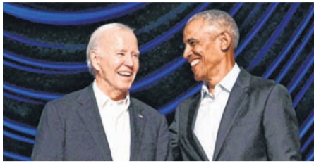
US President Joe Biden (L) and former US President Barack Obama attend a campaign fundraiser

US President Joe Biden has told Americans in a televised address that he decided to end his faltering re-election campaign in a bid to save US democracy.