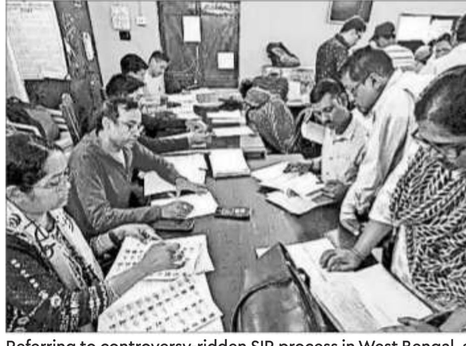
Referring to controversy-ridden SIR process in West Bengal, a bench comprising Chief Justice Surya Kant and Justice Joymalya Bagchi said the exercise had been conducted smoothly across the country except this state

He flagged issues relating to timelines, noting that electoral