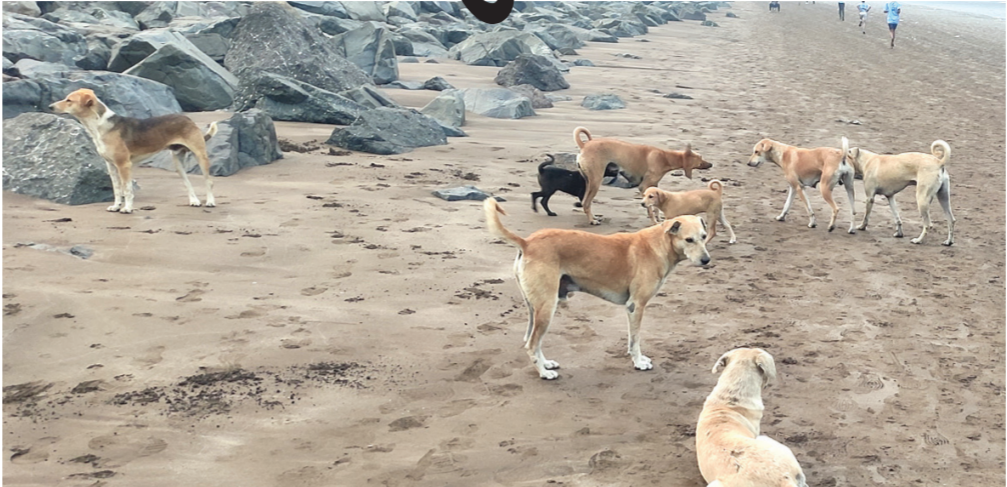
વલસાડના દરિયા કિનારે જોવા મળેલી કૂતરાઓની ટોળી.

એક કૂતરું અન્ય કૂતરાને કડીને ભાગ્યું, આ નાનકડું કૂતરું હડકાયેલું હોવાની આશંકા