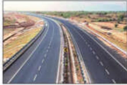
प्रादेशिक आर्थिक विकास, रोजगारनिर्मिती आणि गुंतवणुकीलाही चालना मिळेल, असा विश्वास यानिमित्ताने व्यक्त होत आहे.

मुंबई : महाराष्ट्रातील रत्नागिरी जिल्ह्यातील अत्यंत महत्त्वाचे जयगड बंदर पश्चिम महाराष्ट्रातील साताऱ्याशी जोडण्यात येणार आहे. भारतीय राष्ट्रीय महामार्ग प्राधिकरणाने (एनएचएआय) जयगड बंदर - चिपळूण - सातारा असा ९८ किमीचा द्रुतगती महामार्ग बांधण्याचा निर्णय घेतला आहे. या प्रस्तावित महामार्गामुळे कोकण, जयगड बंदर आणि पश्चिम महाराष्ट्र थेट जोडला जाणार आहे. यामुळे राज्यातील प्रमुख औद्योगिक, कृषी आणि व्यापारी केंद्रांमधून बंदरापर्यंतची मालवाहतूक सुकर आणि अतिजलद होणार आहे. जयगड बंदर ते सातारा अंतर साडेपाच तास ते सहा तासांपेवजी अवघ्या एका