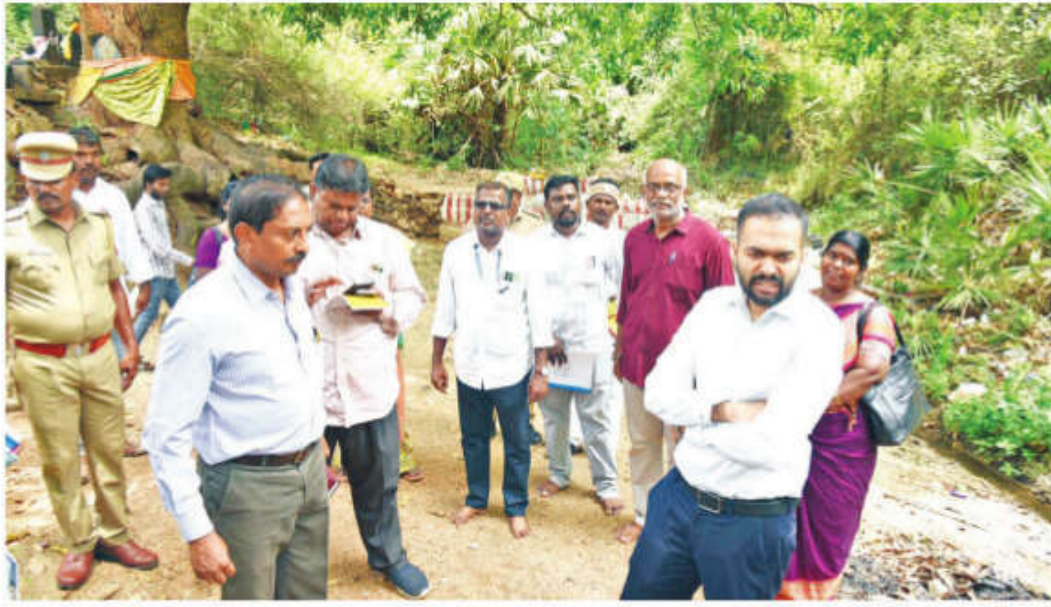
துவரிமான் நாகமலை அடிவாரத்தில் உள்ள புல்வாத்து நீர்நூற்றுப் பகுதியில் புதன் கிழமை ஆய்வு செய்த மதுரை மாவட்ட ஆட்சியர் ப. ஆகாஷ், உடனிருந்த அவர்களுடன்.

மதுரை, ஜூன் 17: மதுரை மாவட்டம், துவரிமான் நாகமலை அடிவாரத்தில் அமைந்துள்ள புல்வாத்து நீர்நூற்றுப் பகுதியில் ஆய்வு செய்த மதுரை மாவட்ட ஆட்சியர் ப. ஆகாஷ், உடனிருந்த அவர்களுடன்.