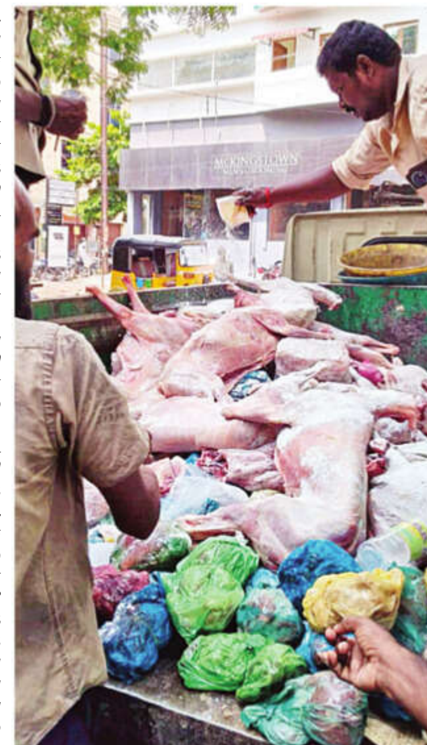
மதுரை ஆர்ப்பாணயம் பகுதியில் உள்ள கடைகளிலிருந்து உணவுப் பாதுகாப்பு அலுவலர்களால் புதன் கிழமை பறிமுதல் செய்யப்பட்ட ஆடு, கோழி இறைச்சிகள்.

மதுரை, ஜூன் 17: மதுரை மாவட்டம், துவரிமான் நாகமலை அடிவாரத்தில் அமைந்துள்ள புல்வாத்து நீர்நூற்றுப் பகுதியில் ஆய்வு செய்த மதுரை மாவட்ட ஆட்சியர் ப. ஆகாஷ், உடனிருந்த அவர்களுடன்.