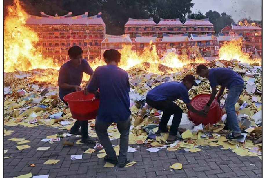
ઈન્ડોનેશિયાના નોર્થ સુમાત્રાના મેદાનમાં ચાઈનીઝ લુનાર ફેસ્ટીવલના ભાગરૂપે હંગરી ધોસ્ટ ફેસ્ટીવલનું આયોજન કરાયું હતું. જેમાં પોતાના મૃતક સ્વજનોની યાદમાં પારંપરિક ચાઈનીઝ નાગરિકોએ પેપરના બનાવટી વાંદરાને સળગાવીને તેમના આત્માની શાંતિ માટે પ્રાર્થના કરી હતી.

ઓહાયો રાજ્યની હાઈવે પેટ્રોલ પોલીસના કહેવા પ્રમાણે સિનસિનાટીમાં આવેલી એફબીઆઈની ઓફિસમાં એક અજાણ્યો શખ્સ બંદૂક લઈને ઘૂસવાની કિરાકમાં હતો. એ દરમિયાન એફબીઆઈ અધિકારીએ તેને રોકવાની કોશિશ કરી હતી. બંને વચ્ચે ઝપાઝપી થઈ હતી. કાર્યવિધનો એલાર્મ વાગ્યો હતો. એ પછી તેણે ભાગવાની કોશિશ કરી હતી, કારમાં ભાગતા પહેલાં આ શખ્સે પોલીસ પર ફાઈરિંગ કર્યું હતું. પોલીસે તેની કારનો પીછો કર્યો હતો. એક સ્થળે રોકાઈને તેણે પોલીસ પર ફાઈરિંગ કર્યું હતું. બંને તરફના ફાઈરિંગમાં પોલીસે આખરે તેને ઠાર કરી દીધો હતો.