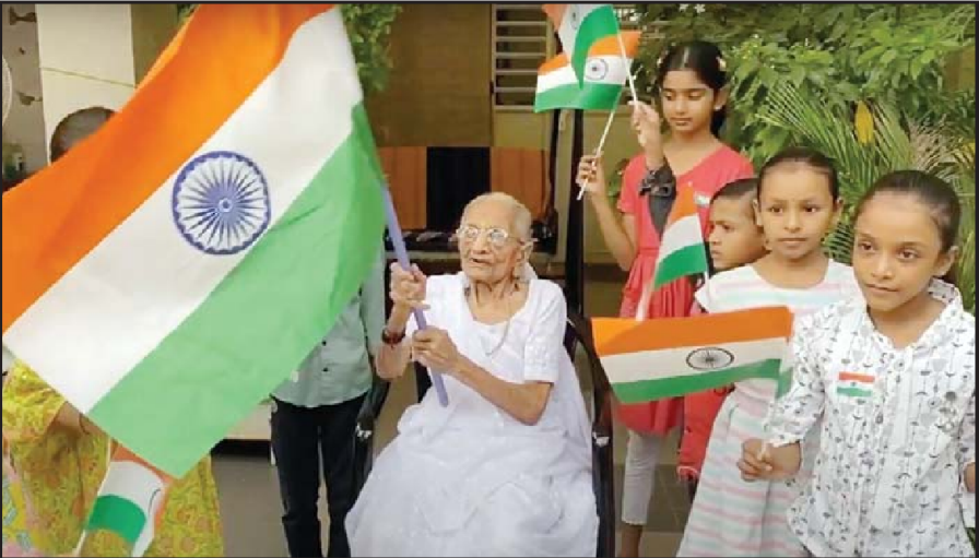
આઝાદીના અમૃત મહોત્સવની ઉજવણીના ભાગરૂપે 'હર ઘર તિરંગા' અભિયાન અંતર્ગત શનિવારે ગાંધીનગરના રાયસણમાં વડાપ્રધાન નરેન્દ્ર મોદીના માતૃશ્રી હીરાબાએ ૧૦૦ વર્ષની જેકવયે પણ પોતાના નિવાસસ્થાને મધ્યમ વર્ગીય અને સામાન્ય પરિવારોના બાળકોને તિરંગાનું વિતરણ કર્યું હતું. તેમજ તેમની સાથે તેમણે પોતે પણ તિરંગો લહેરાવીને રાષ્ટ્રભાવના વ્યક્ત કરી હતી.

તેઓને એડમિશન લેટર મળી જતા હતા. એલીસબ્રિજ પીઆઈ એસજે રાજપૂતે જણાવ્યું હતું કે, આ ત્રણેયના રિમાન્ડ મેળવી પૂછપરછ શરૂ કરી હતી તેઓએ હાલ સુધીમાં રાજ્યભરમાંથી ૬-૭ વ્યક્તિને લાખો રૂપિયા લઈ વિદેશ મોકલ્યા હોવાનું જાણવા મળ્યું હતું.