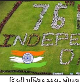
દિલ્હી પબ્લિક સ્કૂલ-બોપલ, અમદાવાદના યુવા વિદ્યાર્થીઓએ આઝાદી કા અમૃત મહોત્સવની ઉજવણીની કેન્દ્ર સરકારની પહેલે સમર્થન આપવા હાથ મિલાવ્યા હતા અને ૨૦૦૦થી વધુ જુનિયર સ્કૂલના વિદ્યાર્થીઓએ ભારતીય સ્વાતંત્ર્ય સંગ્રામ માટે આદર અને કૃતજ્ઞતાના ચિહ્ન તરીકે અને ભારતમાં રાષ્ટ્રવાદને જગાડવાના સરકારના વિજનને પ્રોત્સાહન આપવા માટે ગવર્ધી માનવ સાંકળ બનાવી હતી. સખત મહેનત પરિણમ્યુ હતું.

બનેલા નીતિન પટેલને તાત્કાલિક સારવાર અર્થે કડીની ભાગ્યોદય હોસ્પિટલ ખસેડવામાં આવ્યા હતા. જ્યાં પ્રાથમિક સારવાર લીધા બાદ તેઓ અમદાવાદ તેમના નિવાસસ્થાને ગયા હતા. અગાઉ પણ કડીમાં શાળાએ જતા વિદ્યાર્થીને ઢોરે અડફેટે લેતા તેને ઈજાઓ થઈ હતી. ઉત્તર ગુજરાત હોય કે, સૌરાષ્ટ્ર તમામ જગ્યાએ ઢોરનો ત્રાસ જોવા મળે છે.