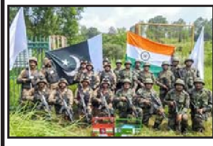
પાકિસ્તાન વિદેશ કાર્યાલયના પ્રવક્તા અસીમ ઈફ્તિખારે કહ્યું કે પાકિસ્તાન એસસીઓના પ્રાદેશિક આંતંકવાદ વિરોધી માળખા (આરએટીએસ) હેઠળ આ વર્ષે ઓક્ટોબરમાં યોજનારી આંતરરાષ્ટ્રીય આંતંકવાદ વિરોધી કવાયતમાં ભાગ લેશે. પ્રવક્તાએ જણાવ્યું હતું કે, "આ કવાયત એસસીઓ આરટીએસના કાર્યક્ષેત્રમાં થશે." ભારત આ વર્ષે એસસીઓ આરટીએસની અધ્યક્ષતા કરી રહ્યું છે.

ઈસ્લામાબાદ,તા.૧૩ | શાંઘાઈ કોઓપરેશન ઓર્ગનાઈઝેશન હેઠળ ભારત દ્વારા હાથ ધરવામાં આવેલી આંતંકવાદ વિરોધી કવાયતમાં પાકિસ્તાન ભાગ લઈ રહ્યું છે. ઓક્ટોબર ૨૦૨૨માં મહેસારમાં ભારતે આંતંકવાદ વિરોધી કવાયત ગોઠવી છે જેમાં પાકિસ્તાન ભાગ લેવાનું છે. પાકિસ્તાનના મીડિયાએ વિદેશ મંત્રાલયને ટાંકીને આ માહિતી આપી છે. પાકિસ્તાનના એક અગ્રણી અખબારના જણાવ્યા અનુસાર, પાકિસ્તાન અને ભારતીય સૈનિકો આંતંકવાદ વિરોધી કવાયતમાં સાથે મળીને ભાગ લેશે. પહેલી વાર ભારતની આંતંક વિરોધી કવાયતમાં પાકિસ્તાન ભાગ લેશે અત્યાર સુધી તો ભારતની આંતંક વિરોધી કવાયતમાં પાકિસ્તાન કદી પણ ભાગ લીધો નથી પરંતુ હવે પહેલી વાર પાકિસ્તાન ભારતની આંતંક વિરોધી કવાયતમાં ભાગ લેશે. પાકિસ્તાન વિદેશ કાર્યાલયના પ્રવક્તા અસીમ ઈફ્તિખારે કહ્યું કે પાકિસ્તાન એસસીઓના પ્રાદેશિક આંતંકવાદ વિરોધી માળખા (આરએટીએસ) હેઠળ આ વર્ષે ઓક્ટોબરમાં યોજનારી આંતરરાષ્ટ્રીય આંતંકવાદ વિરોધી કવાયતમાં ભાગ લેશે. પ્રવક્તાએ જણાવ્યું હતું કે, "આ કવાયત એસસીઓ આરટીએસના કાર્યક્ષેત્રમાં થશે." ભારત આ વર્ષે એસસીઓ આરટીએસની અધ્યક્ષતા કરી રહ્યું છે.