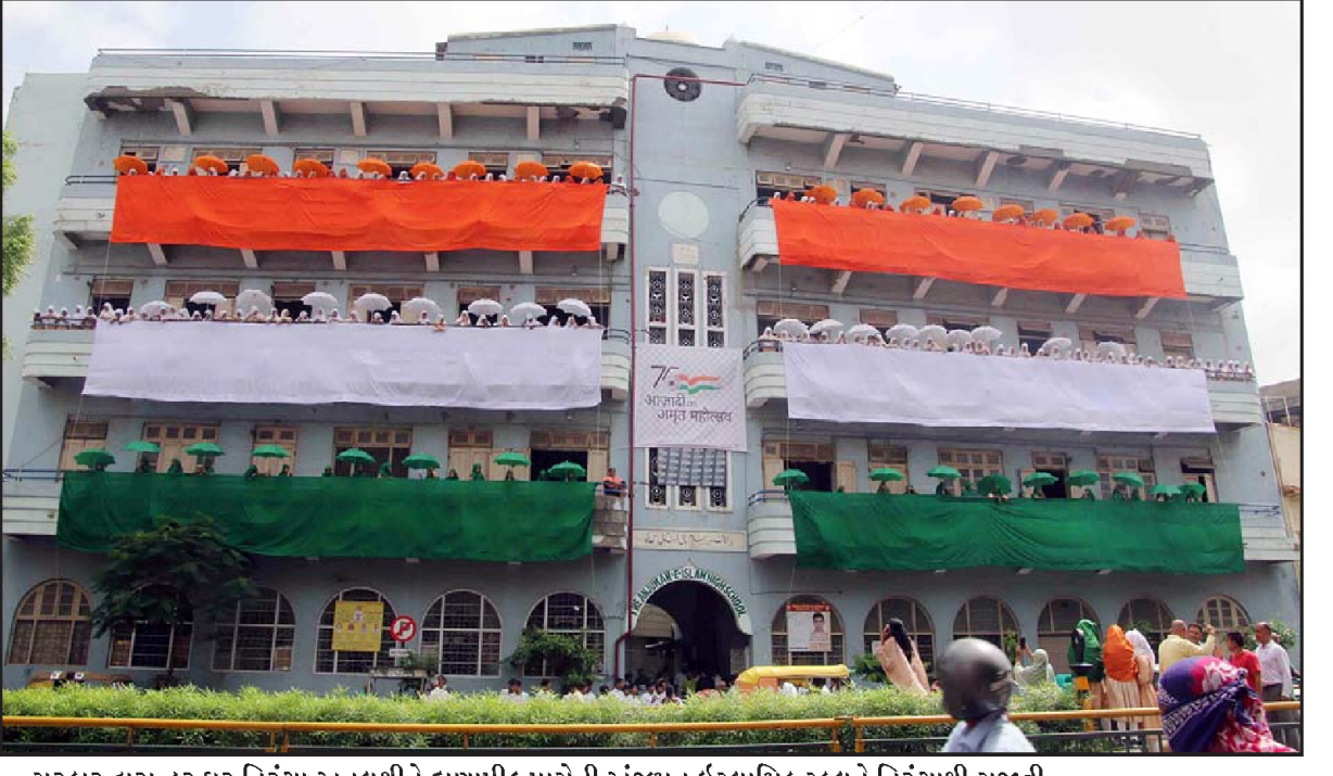
સરકાર દ્વારા હર ઘર તિરંગા અનુલક્ષીને દાણાપીઠ પાસેની અંજુમને ઈસ્લામિક સ્કૂલને તિરંગાથી સજાવી.***

અમદાવાદ, તા. ૧૩ ઈસરો-સેક ગુજકોસ્ટ અને સાયન્સ સીટી દ્વારા દેશના મહાન સારાભાઈ વિશે તથા ભારતીય અવકાશ વિજ્ઞાન વિશે સરપ્રદ માહિતી આપી હતી. ઉપરાંત કાર્યક્રમનું આયોજન કરવામાં આવ્યું હતું જેમાં ડો. વિક્રમ સારાભાઈનું ભારતીય અવકાશ વિજ્ઞાનમાં યોગદાન અને ભારતની અવકાશ ક્ષેત્રમાં સિદ્ધિઓ વિષે વિદ્યાર્થીઓને જાણકારી આપવામાં આવી હતી. આ કાર્યક્રમમાં આશરે ૫૦૦ જેટલા વિદ્યાર્થીઓ અને વિજ્ઞાન રસિકો જોડાયા હતા. આ કાર્યક્રમમાં