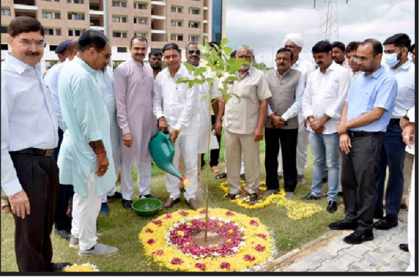
મોરીયા બનાસ મેડિકલ કોલેજમાં વન મહોત્સવની ઉજવણી કરવામાં આવી હતી.

પાલનપુર તા. ૧૩ પાલનપુર તાલુકાના મોરિયા બનાસ મેડિકલ કોલેજ ખાતે અમ્ર, નાગરિક પૂરવઠો અને ગ્રાહકોની બાબતોના મંત્રી તથા જિલ્લાના પ્રભારી મંત્રી ગજેન્દ્રસિંહ પરમારના અધ્યક્ષ સ્થાને ૯૩માં જિલ્લાકક્ષાના વન મહોત્સવની ઉજવણી વૃક્ષોરોપણ કરી કરવામાં આવી હતી. આ પ્રસંગે પ્રભારી મંત્રી ગજેન્દ્રસિંહ પરમારે વન મહોત્સવની શુભેચ્છા પાઠવતાં જણાવ્યું કે ચોમાસાની ઋતુમાં આપણા ઘેરની આજુબાજુ, ખેતરના શેઢે-પાળે વૃક્ષો રોપવાનું પવિત્ર કાર્ય કરવું જોઈએ. તેમણે કલાયમેન્ટ ચેન્જના પડકારો અને વૃક્ષોનું મહત્વ સમજાવતાં જણાવ્યું કે વૃક્ષો મનુષ્યોના જીવનમાં જન્મથી લઈ મૃત્યુ સુધી આપણે સાથ ક્યારેય છોડતા નથી. ત્યારે દરેક વ્યક્તિએ વૃક્ષોનું મહત્વ સમજી વૃક્ષો વાવે તે જરૂરી છે.