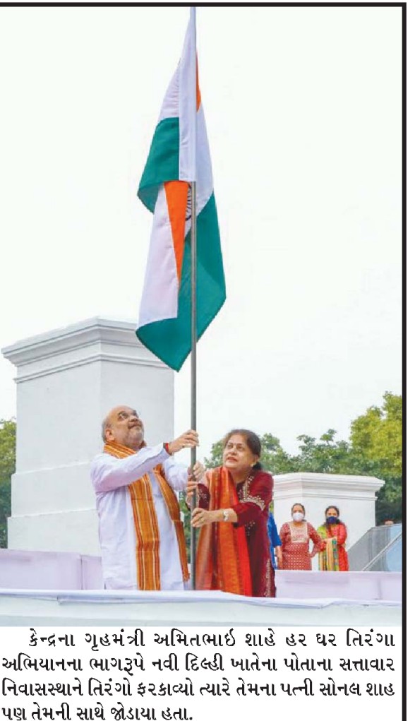
કેન્દ્રના ગૃહમંત્રી અમિતભાઈ શાહે હર ઘર તિરંગા અભિયાનના ભાગરૂપે નવી દિલ્હી ખાતેના પોતાના સત્તાવાર નિવાસસ્થાને તિરંગો ફરકાવ્યો ત્યારે તેમના પત્ની સોનલ શાહ પણ તેમની સાથે જોડાયા હતા.

આવે છે. પ્રધાનમંત્રી આવાસ યોજના (ગ્રામિણ) હેઠળ વર્ષ ૨૦૨૦-૨૧ દરમિયાન મહિલા લાભાર્થીઓને ધ્યાનમાં રાખીને આવાસની સાથે-સાથે શૌચાલયના બાંધકામ માટે પ્રતિ લાભાર્થી રૂ.૫૦૦૦ની વધારાની સહાય આપવાનો નિર્ણય પણ કરવામાં આવ્યો હતો, જે હેઠળ ૯૦૦૦ લાભાર્થીઓને સહાય ચૂકવવામાં આવી છે. પ્રધાનમંત્રી આવાસ યોજના (ગ્રામિણ) હેઠળ ભારત સરકારના ગ્રામિણ વિકાસ મંત્રાલય દ્વારા વર્ષ ૨૦૧૮-૧૯માં રાજ્યના ડાંગ જિલ્લાને અને ૨૦૧૯-૨૦માં પોરબંદર જિલ્લાના રાણાવાવ તાલુકાને બેસ્ટ પર્ફોર્મન્સ ઈન ઈમ્પ્લીમેન્ટેશન ઓફ પીએમએવાય (રૂરલ) અંતર્ગત અનુક્રમે પ્રથમ અને દ્વિતીય ક્રમાંક એવોર્ડ આપવામાં આવ્યો હતો. દેશના સન્માનીય અને આદરણીય વડાપ્રધાનશ્રી નરેન્દ્રભાઈ મોદીના પ્રેરક માર્ગદર્શન અને ભારત સરકારના સહયોગથી મુખ્યમંત્રીશ્રી ભૂપેન્દ્રભાઈ પટેલના નેતૃત્વમાં ગુજરાત સરકાર આજે ગરીબોને સપનાનું ઘર આપી રહી છે. આ ઘર આપવાની પદ્ધતિ સંપૂર્ણ પારદર્શી છે. ડ્રો ના માધ્યમથી લાભાર્થી નક્કી થાય છે. આ લાભાર્થીને મળનારી તમામ સબસિડી તેમના ખાતામાં ડીબીટી(ડાયરેક્ટ બેનિફિટ ટ્રાન્સફર)ના માધ્યમથી જમા થાય છે. રાજ્યના જરૂરીયાતમંદ લોકોને સાડા જીવન ધોરણ પૂરૂ પાડવાની દિશામાં ગુજરાત સરકાર મક્કમ છે.