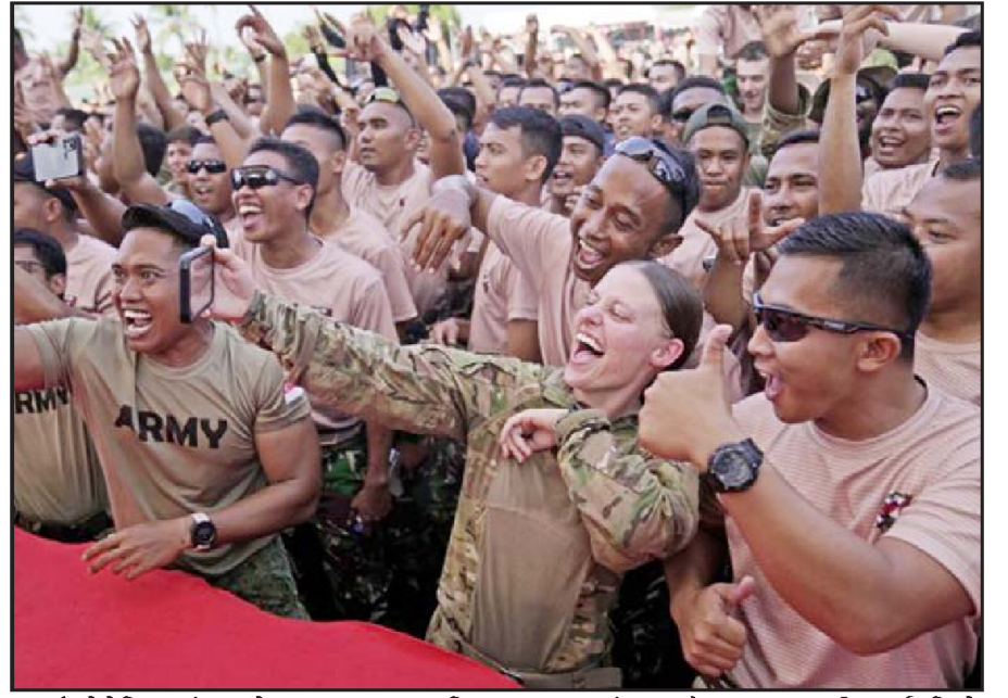
ઈન્ડોનેશિયામાં આયોજન સુપર ગુરુડ શિલ્ડ ૨૦૨૨ સંયુક્ત સૈન્ય અભ્યાસની પૂર્ણાહુતિએ અમેરિકન સૈનિકોએ સંગીત કાર્યક્રમ વખતે સેલ્ફી લીધી હતી, તસ્વીરમાં સૈનિકો ગીત ગાતા નજરે પડે છે.

નબળી નીતિઓ તેને માત્ર પાકિસ્તાનમાં એક પણ સરકારે ગરીબી તરફ લઈ જઈ રહી તેનો પાંચ વર્ષનો કાર્યકાળ પૂર્ણ કર્યો નથી. આ વાત એ જ સાબિત કરી રહી છે કે આ દેશમાં આતંકવાદીઓને આશ્રય મળે છે. પરંતુ સ્થિરતા, વિકાસ, પ્રગતિ બધું જ પાછળ રહી જાય છે. પાકિસ્તાનની હાલની સ્થિતિને આ રીતે સમજી શકાય છે કે હાલમાં લોકોને એક લિટર પેટ્રોલ માટે ૨૪૮ પાકિસ્તાની રૂપિયા ખર્ચવા પડે છે. એ જ રીતે એક લિટર ડીઝલ માટે રૂ. ૨૬૩ ખર્ચવા પડે છે. આ સ્થિતિઓ પર નિષ્ણાતો પોતાની ચિંતા વ્યક્ત કરી રહ્યા છે, આ સિવાય સામાન્ય લોકો પણ ખુલીને બોલવા લાગ્યા છે. વર્તમાન પરિસ્થિતિ પર નારાજગી વ્યક્ત કરતા એક વ્યક્તિએ કહ્યું છે કે પાકિસ્તાનમાં મોંઘવારી વધતી રહેશે, બેરોજગારી પણ વધશે, લોકો મૃત્યુ પામશે, આત્મહત્યા કરશે. આ ડોલરના રેટને અંકુશમાં લેવા માટે પાકિસ્તાન સરકારે કોઈક પગલું ભરવું પડશે. હવે આ માત્ર એક વ્યક્તિનું નિવેદન છે, પરંતુ પાકિસ્તાનના લોકો હજુ પણ આ પરિસ્થિતિ સામે ઝડપી રહ્યા છે. ઉદાસીનતા પ્રવર્તી રહી છે અને આશાનું કોઈ કિરણ નથી.