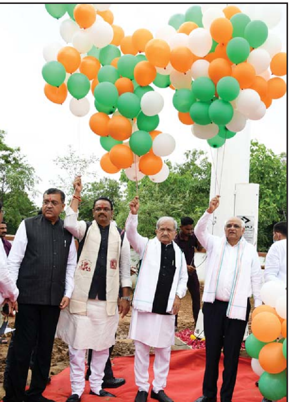
મુખ્યમંત્રી ભૂપેન્દ્ર પટેલે આઝાદીના અમૃત મહોત્સવ અંતર્ગત હર ઘર તિરંગા અભિયાનમાં જોડાઈને ગાંધીનગરમાં ચિલ્ડ્રન યુનિવર્સિટી ખાતે ૧૦૦ ફૂટના ધ્વજ દંડ ઉપર ૩૦x૨૦નો વિશાળ તિરંગો લહેરાવ્યો હતો આઝાદીના પ્રતિકરૂપે રંગબેરંગી કુચ્છા ઉડાડીને મહોત્સવની ઉજવણી કરી હતી.

પણ ભારે વરસાદની આગાહી કરાઈ છે. અમદાવાદ અને ગાંધીનગરમાં સામાન્ય વરસાદ વરસી શકે છે. અમદાવાદના અનેક વિસ્તારોમાં પવન સાથે વરસાદ અમદાવાદ શહેરમાં આજે ભારે પવન સાથે વરસાદ વરસ્યો હતો. વરસાદના કારણે