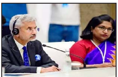
૧૫ ઍન્ટરનશનલ વાતચીત થઈ છે. બંને પક્ષો દ્વારા તે સ્થળોએથી ખસી જવા અંગે ઘણા મહત્વપૂર્ણ નિર્ણયો લેવામાં આવ્યા છે. અમે તેનો

નવીદિલ્હી,તા.૧૩ | ભારત-ચીન મુદ્દે વિદેશ મંત્રી એસ જયશંકરે કહ્યું કે અમે અમારું વલણ જાળવી રાખ્યું છે કે જો ચીન સરહદી વિસ્તારોમાં શાંતિ ભંગ કરશે તો તેની અસર અમારા સંબંધો પર પડશે. આપણા સંબંધો સામાન્ય નથી, તે સામાન્ય ન હોઈ શકે કારણ કે સરહદની સ્થિતિ સામાન્ય નથી. જયશંકરે કહ્યું કે ભારત સતત તેના સ્ટેન્ડ પર અડીખમ છે કે જો ચીન સરહદી વિસ્તારોમાં શાંતિ ભંગ કરે છે અથવા નિયમોનું ઉલ્લંઘન કરે છે તો