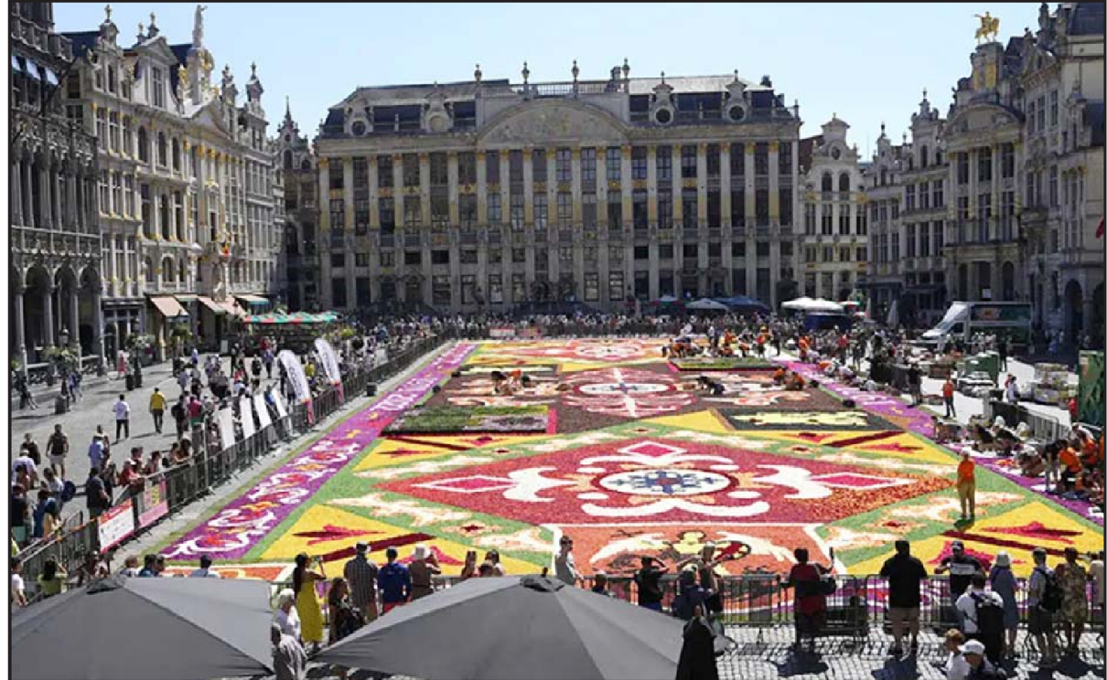
બુસેલ્સના ઐતિહાસિક ગ્રાન્ડ પ્લેસ ખાતે સ્વયંસેવકો દ્વારા વિશાળ ફુલોનું જાજમ બનાવવામાં આવ્યું હતું. તસ્વીરમાં તેઓ ફુલોના જાજમને આખરી ટચ આપતા જણાય છે. જેને જોવા માટે મોટી સંખ્યામાં લોકો ઉપસ્થિત રહ્યાં હતા.

ગેરકાયદેસર છે. આ યુરોપનો સૌથી લાંબો આઈસ રોડ છે, એટલે કે આ જગ્યા પરનો રોડ કોઈકીટનો નથી, પણ જામી ગયેલો બરફ છે. અહીં વાહન ચલાવતા લોકો માટે સીટબેલ્ટ પહેરવાની સખત મનાઈ છે અને