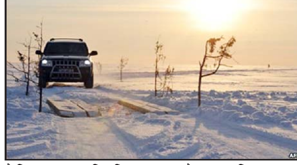
જે લિયુમા ટાપુના દરિયાકિનારા પર હાજર છે. અહીં ડ્રાઈવિંગ કરવું એ પોતાનામાં એક અલગ જ અનુભવ છે, પરંતુ અહીં ડ્રાઈવિંગને લગતા કાયદા અને નિયમો પણ અલગ છે. જો તમારે ગણાશે. આ સિવાય આ જગ્યાએ વાહનની સ્પીડ ૨૫-૪૦ કિમી પ્રતિ કલાકની રાખવી પડશે. તે વિચિત્ર લાગે છે, પરંતુ તે તમારી સુરક્ષા માટે છે. આ સ્થાનનો ઉપયોગ ૧૩મી સદીમાં

સામાન્ય રીતે રોડ પર ડ્રાઈવિંગ કરતી વખતે સીટબેલ્ટ પહેરવો જરૂરી છે, પરંતુ એસ્ટોનિયામાં ૨૫ કિમીનો રસ્તો એવો છે જ્યાં સીટબેલ્ટ પહેરવો તેમના વાહનની સ્પીડ પણ નક્કી કરવામાં આવી છે. યુરોપનો સૌથી લાંબો આઈસ રોડ બાલ્ટિક સમુદ્રનું થીજી ગયેલું સ્વરૂપ છે, આ રસ્તા પર વાહન ચલાવવું હોય તો વાહનના સીટબેલ્ટને થોડીવાર માટે ભૂલી જવું, કારણ કે તેને પહેરવું ગેરકાયદેસર