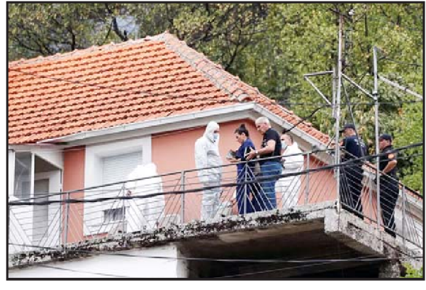
૧૧ લોકો માર્યા ગયા હતા. મોન્ટેનેગ્રોના જાહેર પ્રસારણકર્તા આરટીસીએ શુક્રવારે જણાવ્યું હતું કે, "અગિયાર લોકો માર્યા ગયા હતા, જ્યારે પોલીસના સભ્ય સહિત છ લોકો ઘાયલ થયા

સેટિનજે,તા.૧૩ | મોન્ટેનેગ્રોના સેન્ટ્રલ શહેર સેટિનજેમાં સામૂહિક ગોળીબારમાં ઓછામાં ઓછા ૧૧ના મોત ન આપવાની શરતે વાત કરનાર એક પોલીસ અધિકારીએ પણ એએફપીને આ