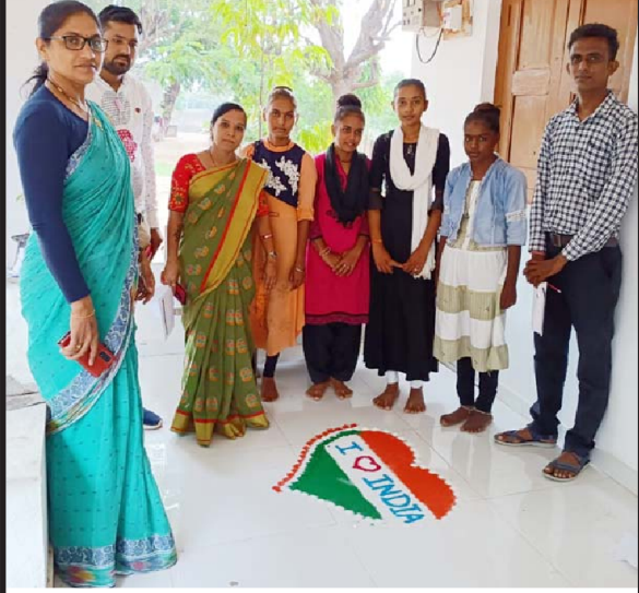
બામણા કોલેજમાં રંગોળી સ્પર્ધા યોજાઈ હતી.