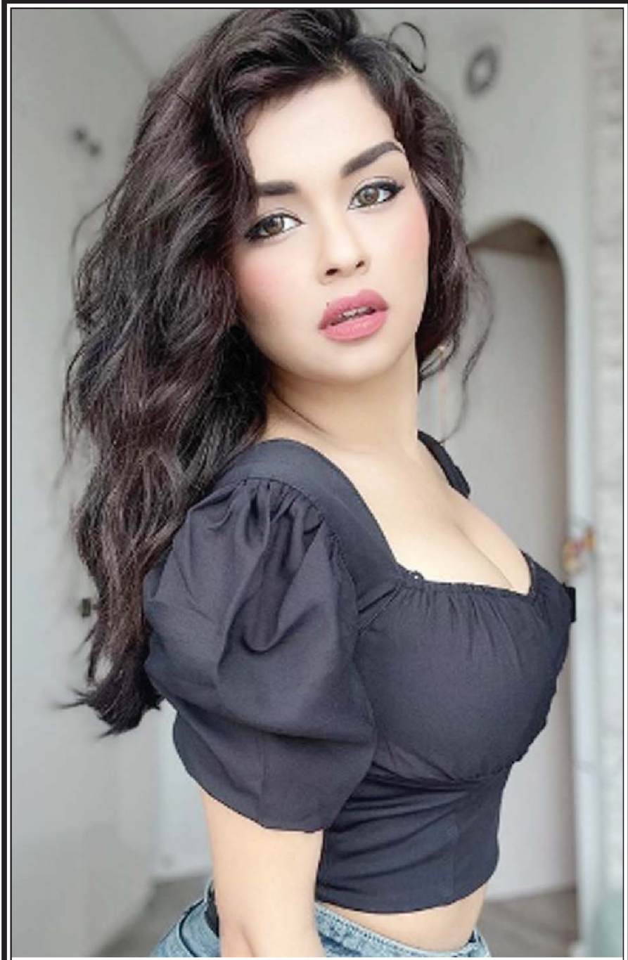
બોલીવુડ એક્ટ્રેસ અવનીત કૌરે હોટ અંદાજમાં પોતાની નવી તસ્વીર યાહકો માટે શેર કરી છે, પોતાની આગામી ફિલ્મ રજૂ થતાં સુધીમાં તે ચર્ચામાં રહેવા બોલેડ અને હોટ તસ્વીરો શેર કરી રહી છે.