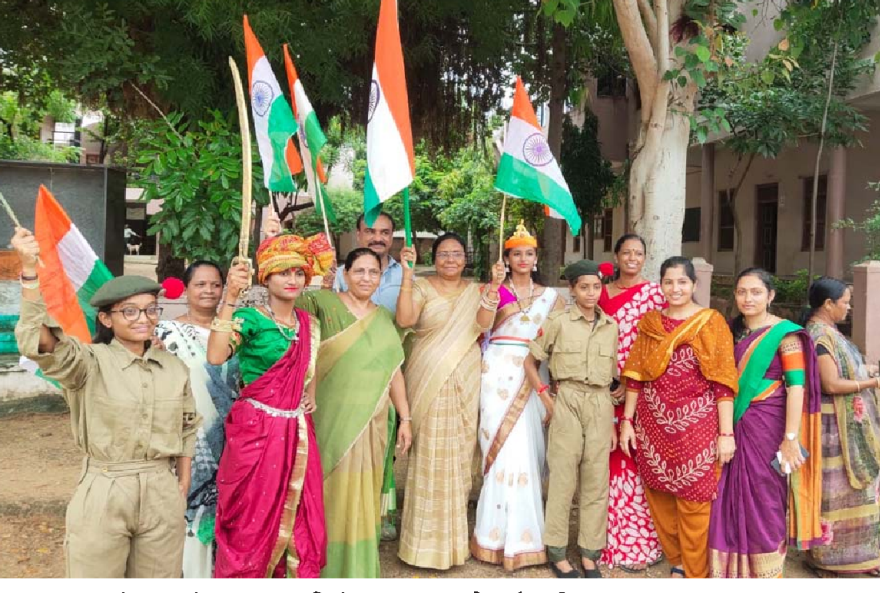
ધનસુરામાં ગ્રામ પંચાયત દ્વારા તિરંગા પદયાત્રા યોજાઈ હતી.

તારીખ. ૧૨-૮-૨૦૨૨ શુક્રવારના રોજ શ્રી ભક્તામર મહા પૂજન રાખવામાં આવેલ જેની ઝઝગાથાઓ શાસ્ત્રોક્ત રીતે વાંજિતો સાથે વિધિ કારક દિપેનભાઈએ ભક્તામર મહા પૂજન ભણાવેલ હતું. જેમાં પણ શ્રાવણ સુદ પૂનમ શુક્રવારે શ્રી વાસુ પૂજ્ય જિનાલયે ભવ્ય રીતે આવેલ શ્રી અમી ઝર. વાસુ પૂજ્ય સ્વામી ભગવાનના શિખર ઉપર પ્રજા યજ્ઞવાવાનું ૭૦૦૭૦ મણ ધી થયેલ હતું. શ્રાવણ વદ એકમ શનિવારે સવારે ૯.૨૭ મિનિટે પ્રભુજીના મુખ્ય શિખર ઉપર શાસન પ્રજા તથા લીલી ધજા આરોહણ કરવામાં આવેલ. તે સિવાય ૩૧ ટેરીઓના શિખર ઉપર ધજા આરોહણ કરવામાં આવેલ તે સમયે સુરેન્દ્રનગર જૈન સંઘના દરેક સભ્યો ઉપસ્થિત હતા. ત્યારબાદ સમુદ્રસ્નાન ભણાવવામાં આવેલ અને પછી શ્રી વાસુ પૂજ્ય સ્વામી દાદાની પહેલી પૂજાનું ધી બોલાવવામાં આવેલ હતું. ત્યારબાદ બપોરે સંઘનું સ્વામિ વાતસલ્ય રાખવામાં આવ્યું હતું.