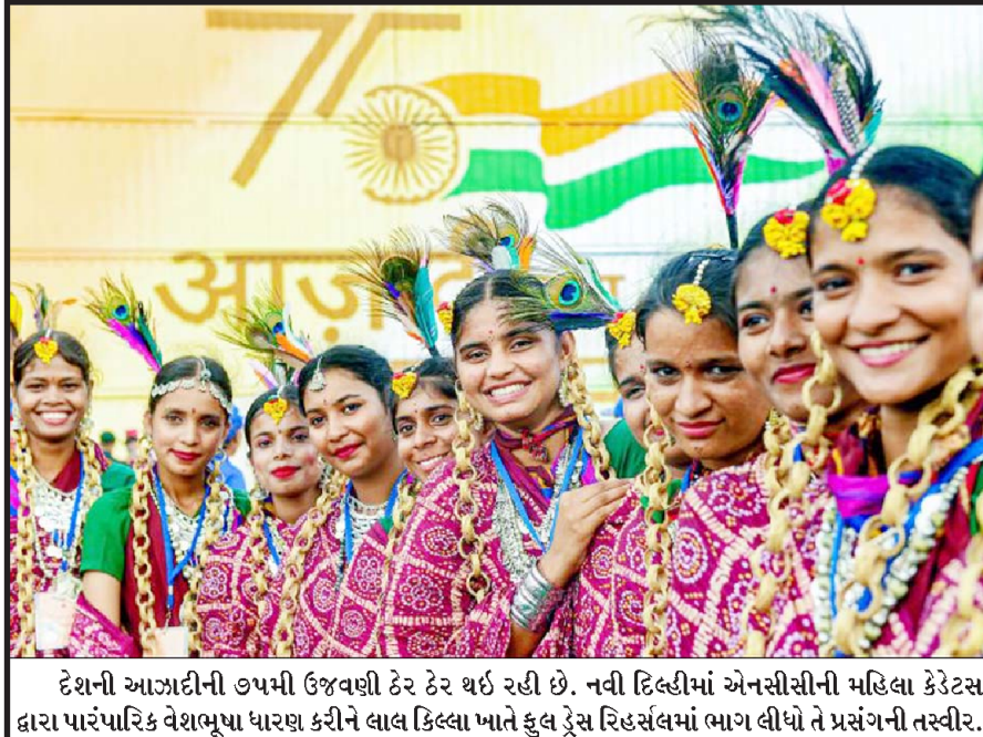
દેશની આઝાદીની ૭૫મી ઉજવણી ઠેર ઠેર થઈ રહી છે. નવી દિલ્હીમાં એનસીસીની મહિલા કેડેટસ દ્વારા પારંપારિક વેશભૂષા ધારણ કરીને લાલ કિલ્લા ખાતે કુલ ટ્રેસ રિહસલમાં ભાગ લીધો તે પ્રસંગની તસ્વીર.

નવી દિલ્હી, તા. ૧૩ દેશમાં ચેરીટેબલ ટ્રસ્ટો અને આ પ્રકારની સંસ્થાઓ દ્વારા રાખવામાં આવતા હિસાબોના નિયમોમાં મોટા ફેરફાર કરવામાં આવ્યા છે. સેન્ટ્રલ બોર્ડ ઓફ ડાયરેક્ટ ટેક્સ દ્વારા તમામ ચેરીટેબલ ટ્રસ્ટો, યુનિવર્સિટીઓ તથા તમામ સંસ્થાઓ કે જે તેમને મળતા બંડોળમાં આવકરના મુક્તિ મેળવે છે તેઓને હિસાબો વ્યવસ્થિત રાખવા, પેમેન્ટના ઓરિજનલ બીલ પણ મેળવવા ઉપરાંત જે લોગો આ પ્રકારની સંસ્થાઓને દાન આપતા હોય તેના પાન ઉપરાંત આધાર કાર્ડના ડેટા અને સરનામા મેળવવા તથા ટ્રસ્ટ દ્વારા જે લોન મેળવવા હોય અથવા તો રોકાણ કરાવું હોય તેમાં પણ ટ્રસ્ટીઓને ડોનરના પાન-આધાર સહિતની માહિતી રાખવા આદેશ આપવામાં આવ્યો છે. આ ઉપરાંત તમામ ચેરીટેબલ ટ્રસ્ટોને છેલ્લા ૧૦ વર્ષના રેકોર્ડ પર રાખવા પણ સૂચના આપવામાં આવી છે જેના કારણે આવકવેરા વિભાગ તેના હિસાબોની યોગ્ય રીતે ચકાસણી કરી શકશે. ઉપરાંત તેમને વિદેશી મળતા બંડોળ અંગે પણ તેઓએ સ્પષ્ટ માહિતી રાખવી જરૂરી બનશે. આ ઉપરાંત ટ્રસ્ટ અને ઈન્સ્ટીટ્યુશન દ્વારા તેઓ જે પ્રોજેક્ટ હાથમાં લે તેમાં સ્વેચ્છિક દાતાઓ તથા ટ્રેક ડંડ ટ્રાન્સફરની માહિતી પણ સ્પષ્ટ રાખવાની રહેશે.