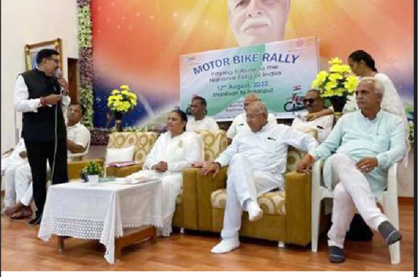
માઉન્ટ આબુથી પાલનપુર સુધી બ્રહ્માકુમારીઝ દ્વારા તિરંગા બાઈક રેલીનું આયોજન કરાયું

પાલનપુર, તા. ૧૩ હિંમતનગર થી મેરવાડા સુધી નેશનલ હાઈવે-૫૮ સરકાર દ્વારા જાહેર કરવામાં આવેલ છે. વડગામ અને ખેરાલુ તાલુકાને જોડતા નેશનલ હાઈવે-૫૮ ઉપર અને પિલૂયા ચોકડી પર પાણી ભરાતું હતું જેને લઈ ગત ચોમાસાએ નેશનલ ઓથોરિટીના અધિકારીઓએ ત્યાં ચેમ્બર બનાવી ગટર નાંખી સરસ્વતી નદીમાં ગટર લાઈન કાઢી પાણીનો નિકાલ કર્યો હતો. આ ચોમાસાએ જ્યાં પાણી ભરાઈ રહે છે તે ગટરની ચેમ્બરમાં માટી ભરાઈ જવા પામી છે અને ચેમ્બરના ઢાંકણા તૂટી ગયા છે. વારંવાર વરસાદ પડવાથી ત્યાં પાણી ભરાય છે આથી વાહનચાલકો પરેશાની ભોગવી રહ્યાં છે ત્યારે જવાબદાર અધિકારીએ ચોમાસા પહેલા ગટરની સાફ-સફાઈ કરાવી અને ઢાંકણા તૂટી ગયા છે તેની તપાસ કરવાની હોય છે. દરમ્યાન ગટર પૂરાઈ જવાથી વાહનચાલકો પરેશાની ભોગવી રહ્યાં છે તે બાબતે હજુ સુધી કોઈ જ તપાસ નથી કરી. ત્યારે સરકાર દ્વારા જવાબદાર અધિકારીઓ સામે આ બાબતે યોગ્ય પગલાં ભરવામાં આવે તેવી વાહનચાલકોમાં માંગ ઉઠવા પામી છે.