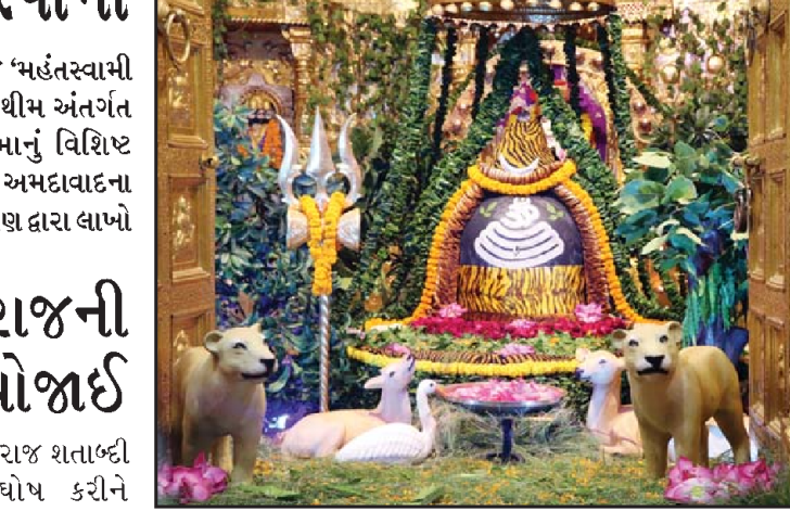
પવિત્ર શ્રાવણ વદ બીજાના દિવસે ભગવાન સોમનાથ મહાદેવને લીલોતરી શૃંગાર દર્શન કરવામાં આવેલ તે તસ્વીરમાં નજરે પડે છે.