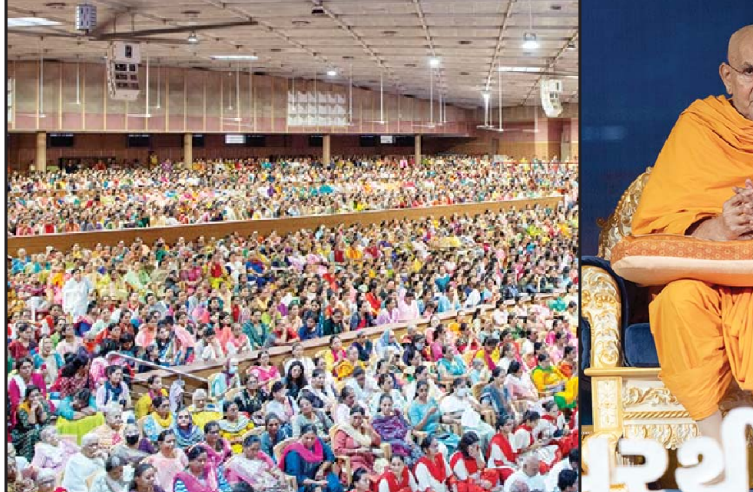
પ.પૂ. પ્રમુખ સ્વામી મહારાજે સમાજ અને રાષ્ટ્ર માટે ઘણું કર્યું છે

મુજબ રાજકોટમાં ૫૮, વડોદરામાં ૪૦, સુરતમાં ૨૯, ગાંધીનગરમાં ૮, જામનગરમાં ૭ અને ભાવનગરમાં ૪ કેસ નોંધાયા હતા. જિલ્લા વિસ્તારમાં નોંધાયેલા આંકડા મુજબ ગાંધીનગરમાં ૨૭, કચ્છમાં ૨૫, વલસાડમાં ૨૨, સુરતમાં ૧૮, રાજકોટમાં ૧૫, પાટણ, વડોદરામાં ૧૪-૧૪, મહેસાણામાં ૧૩, નવસારીમાં ૧૨, બનાસકાંઠામાં ૧૧ કેસ નોંધાયા હતા. જ્યારે મોરબીમાં ૮, આણંદ, ભરૂચમાં