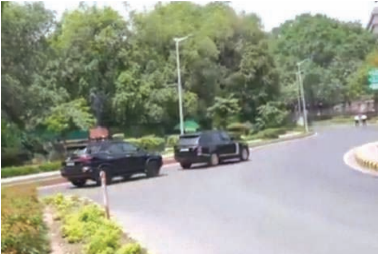
7, लोक कल्याण मार्ग से केवल दो वाहन के साथ निकले प्रधानमंत्री नरेंद्र मोदी

प्रधानमंत्री नरेंद्र मोदी बुधवार सुबह अपने निवास 7, लोक कल्याण मार्ग से केंद्रीय मंत्रिमंडल की बैठक में शामिल होने के लिए केवल दो वाहनों के काफिले के साथ निकले। कई केंद्रीय मंत्री, राष्ट्रीय जनतांत्रिक गठबंधन (राजग) के मुख्यमंत्रियों और राज्यपालों ने भी उनका अनुसरण करते हुए अपने-अपने काफिले के वाहनों की संख्या कम करने की घोषणा की है। भारतीय जनता पार्टी (भाजपा) के राष्ट्रीय अध्यक्ष नितिन नवीन ने भी अपने काफिले की गाड़िया घटा दीं।