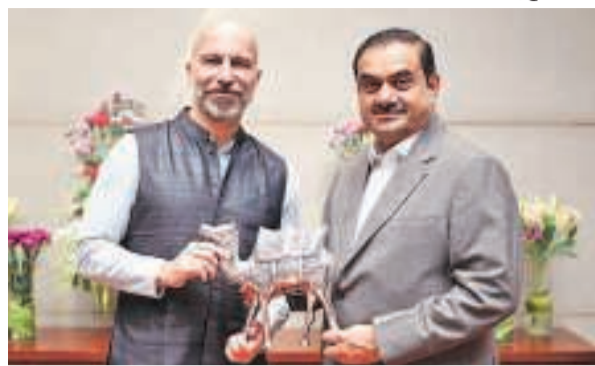
Uber CEO Dara Khosrowshahi and Adani Group Founder and Chairman Gautam Adani in Ahmedabad on Wednesday

During the visit, Khosrowshahi met Finance Minister Nirmala Sitharaman to discuss the company's investment road map for India and the role mobility platforms could play