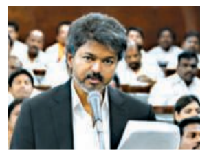
सी जोसेफ विजय

तमिलनाडु में चार दिन पहले सी जोसेफ विजय के नेतृत्व में बनी तमिलना गवर्नर कषणम (टीवीके) सरकार ने बुधवार को विधान सभा में विश्वास मत हासिल कर लिया। द्रविड़ मुनेत्र कषणम के बहिरंगमन के बीच अन्नाद्रमुक के 25 बागियों के समर्थन से टीवीके आसानी से बहुमत का आंकड़ा पार करने में सफल रही और सरकार के पक्ष में 144 जबकि विरोध में केवल 22