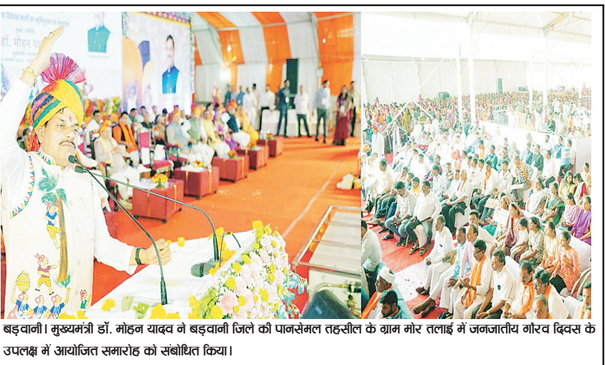
बड़वानी। मुख्यमंत्री डॉ. मोहन यादव ने बड़वानी जिले की पानसेमल तहसील के राम मोर तलाई में जनजातीय गौरव दिवस के उपलक्ष्य में आयोजित समारोह को संबोधित किया।