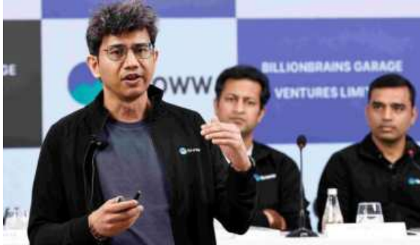
NEW PLATFORM. Lalit Keshre, Co-founder and CEO, Groww, launching the company's public offer in Mumbai

The proceeds from the fresh issue will be used to fund cloud and technology upgrades, scale up the margin trading facility (MTF) business, support performance marketing, strengthen capital in key subsidiaries and pursue inorganic growth