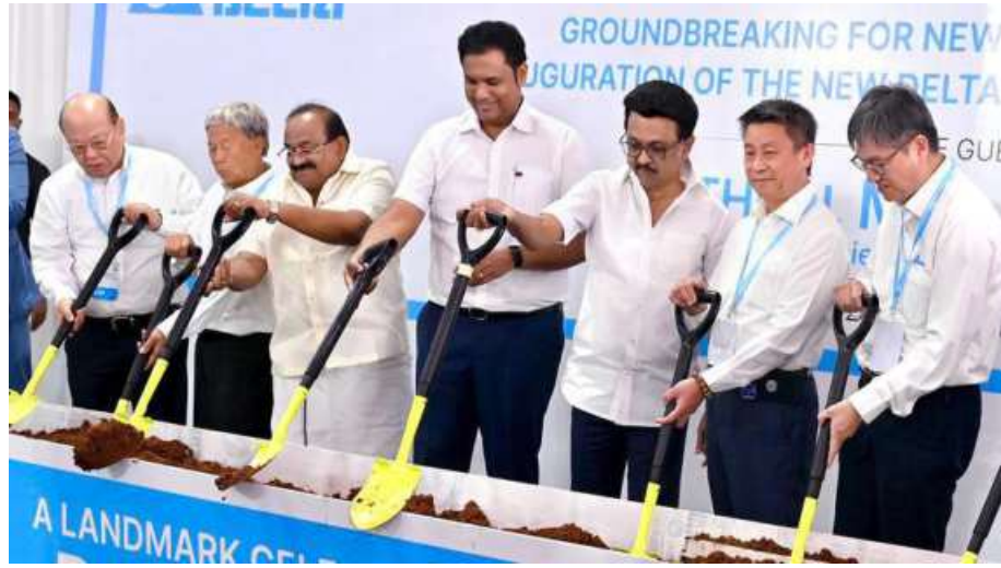
BREAKING GROUND. MK Stalin, Tamil Nadu Chief Minister, and TRB Rajaa, TN Industry Minister, along with the top officials of Delta Electronics at the inauguration of the new factories. BUJOY GHOSH

"As a next step, you should consider expanding your operations to the central and western regions of Tamil Nadu. Moreover, given our immense talent potential, I also urge you to establish an R&D Centre here," he said during the ceremony.