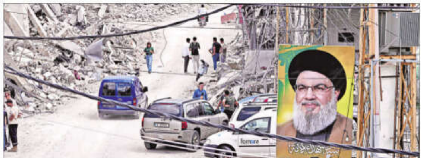
People returning to their villages following the announcement of an initial ceasefire agreement between the US and Iran, in south Lebanon on Monday

Prime Minister Narendra Modi welcomed the understanding between the US and