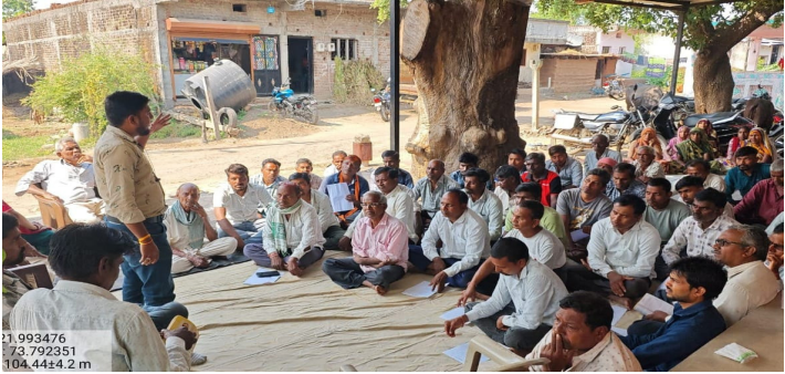
પ્રાકૃતિક કૃષિની રૂબેરૂને પ્રોત્સાહન આપીને આગમી ઋતુ રવિચિણાણ પાક માટે પ્રાકૃતિક કૃષિથી નવા વાવેતર માટે સંપૂર્ણ માર્ગદર્શન

છોટાઉદેપુર જિલ્લામાં ખેડૂતોને પ્રાકૃતિક કૃષિની તાલીમ આપી પ્રાકૃતિક કૃષિ તરફ વળા સધન પ્રયાસ કરવામાં આવી રહ્યો છે. જેમાં આત્મા પ્રોજેક્ટ તેમજ ગુજરાત પ્રાકૃતિક કૃષિ વિકાસ બોર્ડ દ્વારા છોટાઉદેપુર જિલ્લાના તમામ તાલુકાઓમાં નેશનલ મિશન અને નોન-મિશન કલસ્ટરદીઠ રવિ પાકોમાં પ્રાકૃતિક કૃષિ માટે પૂર્વ વાવણી અંગે તાલીમનું આયોજન કરવામાં આવ્યું છે.