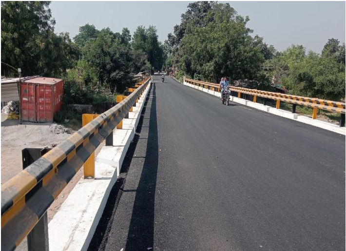
હોવાથી ડાયવર્ટ થયેલ રસ્તા પરના સુવિધા પૂરી પાડવામાં આવશે. રાહદારીઓ માટે વાહન વ્યવહાર માટે યોગ્ય