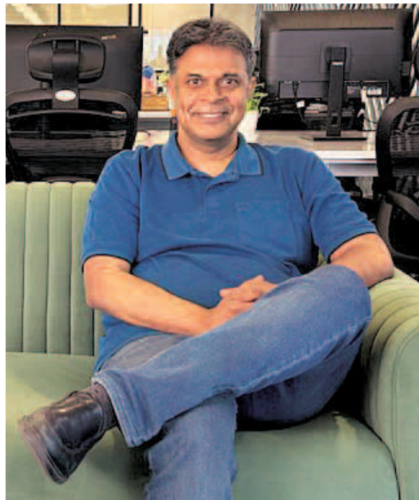
“WILL COME OUT WITH AGENTIC ORCHESTRATION PRODUCTS RELEVANT TO ENTERPRISES IN INDIA”

When you say Sarvam wants to build a sovereign AI offering, does that mean you will not work with foreign investors, or that you would not want them to have a majority stake? Also, the sovereign AI conversation has accelerated again after what happened with Anthropic. What concerns does this create for the enterprise AI ecosystem, and what role can companies like Sarvam play?