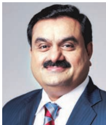
Every challenge sharpens our resolve, said Adani Group Chairman Gautam Adani on the investigations against the group

"Let me be clear, this was not the first time we have been tested, nor