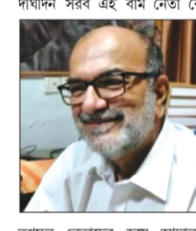
তৃণমূল নেতাদের হয়ে আদালতে সওয়াল করবেন, তা নিয়েই শুরু হয়েছিল বিতর্ক।