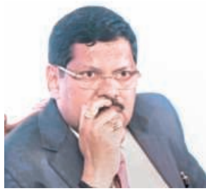
CJI B R Gavai said "I will look into it", when another plea relating to stray dogs was mentioned before him

On Wednesday, the lawyer referred to a May 2024 order