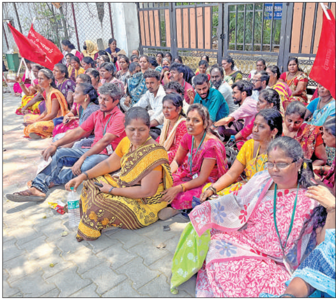
தாம்பரம் மெப்ஸ் வளாகத்தில் உள்ள தனியார் நிறுவனத்தில், பல ஆண்டுகளாக பணிபுரியும் பெண் ஊழியர்கள், தங்களுக்கு வழங்கப்பட்டு வந்த வாகன போக்குவரத்து நிறுத்தப்பட்டதை கண்டித்து, மெப்ஸ் வளாகம் அமைந்து போராட்டத்தில் ஈடுபட்டனர்.

தாம்பரம் தாம்பரம் சானடோரியத்தில் மெப்ஸ் ஏற்றுமதி வளாகம் உள்ளது. இங்கு 150 நிறுவனங்கள் உள்ளன. இந்த நிறுவனங்களில் ஊழியர்கள் பலர் பணி புரிந்து வருகின்றனர். இந்நிலையில் நேற்று காலை 100 பெண் ஊழியர்கள், வாகன போக்குவரத்து நிறுத்தப்பட்டதை கண்டித்து மெப்ஸ் வளாகம் அமைந்து போராட்டம் நடத்தினர். இது குறித்து பெண் ஊழியர்கள் கூறியதாவது: மெப்ஸ் வளாகத்தில் உள்ள செலிபிரிட் பேஷன் என்ற நிறுவனத்தில் ஒவ்வொருவரும் 10 ஆண்டு களுக்கு மேலாக பணிபுரிந்து வருகிறோம். சூனாம்பேடு, மேல்மருவத்தூர், பூந்தமல்லி, மதுராங்கமம், பழந்தண்டலம், குன்றத்தூர், மாம்பாக்கம் உள்ளிட்ட பகுதிகளில் இருந்து பணிக்கு வருகிறோம்.