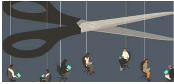
CHUNKY WORKFORCE. Zinnov's India GCC Report counts 2,117 GCCs in India, a $98.4 billion market employing 2.36 million people and now the world's largest AI hiring market

While the old model rewarded headcount, the new one is AI-led. Software and data now do much of that