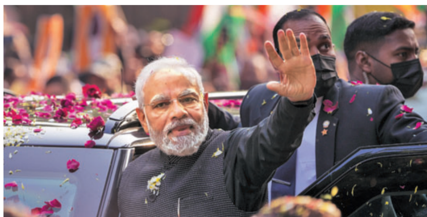
BJP workers and supporters lined the roads to greet Prime Minister Narendra Modi during his roadshow even as the party's two-day national executive began in Delhi on Monday. Huge cutouts of the PM were placed along the road, besides several posters highlighting various initiatives of the government and India's G20 presidency