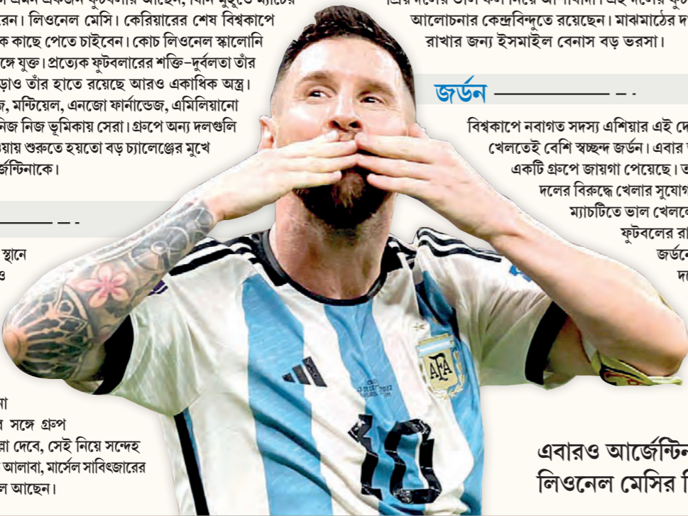
এবারও আর্জেন্টিনা থাকিয়ে লিওনেল মেসির দিকে

১৯৫৪ বিশ্বকাপে তৃতীয় স্থানে থাকার অস্ট্রিয়ার এখনও পর্যন্ত সবচেয়ে বড় সাফল্য। এরপর থেকে ইওরোপের এই দেশটি তেমন কিছু অর্জন করতে পারেনি। আর্জেন্টিনা কিংবা আলজেরিয়ার সঙ্গে গ্রুপ পর্বে তারা কতটা পারা দেবে, সেই নিয়ে সন্দেহ থেকেই যাচ্ছে। ডেভিড আলাবা, মার্সেল সাব্বিতজারের মতো ফুটবলাররা দলে আছেন।