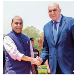
रक्षा मंत्री राजनाथ सिंह, इटली के रक्षा मंत्री गुइडो क्रोसेटो

रक्षा मंत्रालय ने कहा कि सिंह और क्रोसेटो ने दोहरीया कि भारत-इटली रणनीतिक साझेदारी शांति, स्थिरता, स्वतंत्रता और आपसी सम्मान के साझा मूल्यों पर आधारित है। मंत्रालय के अनुसार, 'विभिन्न