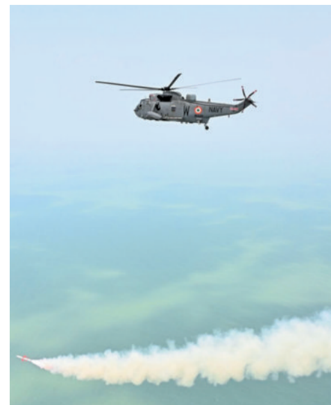
NASM-SR being test-fired from an Indian Navy helicopter off the Odisha coast

The MoD said the missile uses a solid propulsion booster and long-burn sustainer. All critical subsystems like the seeker, integrated avionics module, advanced navigation and guidance using fibre-optic gyroscope-based Inertial Navigation System (INS) and radio-altimeter, along with advanced control and guidance algorithm, high-bandwidth two-way data link and Jet-vane control have