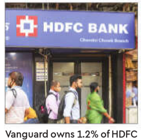
Vanguard owns 1.2% of HDFC Bank worth ₹15,431 crore

The fund house offers two classes of funds: investor shares