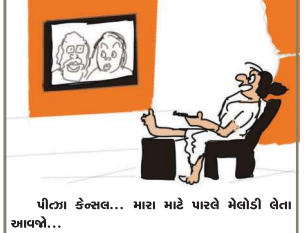
પીટા કનેલ... મારા માટે પારલે મેલોકી લેતા આવવો...