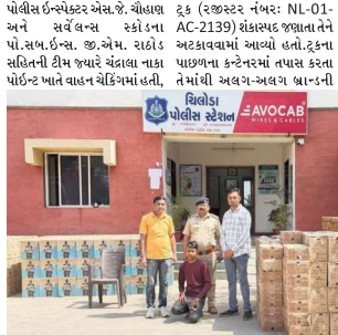
તે દરમિયાન પાનગી બાતમીદાર પોલીસે ચોકસાઈ માહિતી મળી હતી. આ બાતમીના આધારે વૉચ ગોઠવતા, હિંમતનગર તરફથી આવતો ટ્રાક કંપનીનો એક કન્ટેનર

ગોધીનાર સમાચાર ગોધીનાર, તા. ૨૦ ચિલોડા પોલીસે ચંદ્રનાથ પાટીલ પોંટ-૨ પરથી વિદેશી દારૂ બંધર કરવામાં આવેલ છે. પોલીસને કન્ટેનર ટ્રકમાંથી વિદેશી દારૂની ૮૧૫ પેટી કબજા કરી. ૧.૫૬ કરોડનો મુદામાલ સાથે એક શખ્સની ધરપકડ કરી કુલ રૂાિયા ૧.૫૬ કરોડનો મુદામાલ કબજા કરી રૂાિયા ૧.૫૬ કરોડનો મુદામાલ કબજા કરી રૂાિયા ૧.૫૬ કરોડનો મુદામાલ કબજા કરી રૂાિયા ૧.૫૬ કરોડનો મુદામાલ કબજા કરી