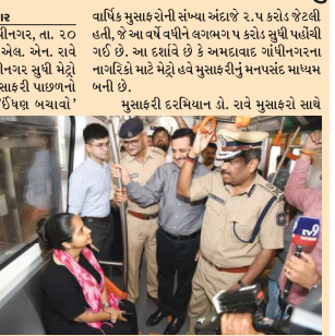
વર્ષિક મુસાફરીનો સંખ્યા અંદાજે ૨.૫ કરોડ કરી હતી. જે આ વર્ષે વધીને લગભગ ૩ કરોડ સુધી પહોંચી ગઈ છે. આ દરમિયાન એક અમદાવાદ ગોધીનારના નાવિકો માટે મેટ્રો હવે મુસાફરીનું મનાવેલ માધ્યમ બની છે. મુસાફરી દરમિયાન ડો. રાવે મુસાફરો સાથે ઈશ્વર બચાવ

ગોધીનાર સમાચાર ગોધીનાર, તા. ૨૦ રાજ્ય પોલીસ વડા ડો. કે. એલ. એન. રાવે આજે રાજીવ મેટ્રો સ્ટેશનની ગોધીનાર સુધી મેટ્રો ટ્રેનમાં મુસાફરી કરી હતી. આ મુસાફરી પાછળનો મુખ્ય ઉદ્દેશ્ય વડાપ્રધાનશ્રીના અધિવાસને પ્રોત્સાહન આપવાનો અને મેટ્રો સ્ટેશનની સુરક્ષા અને વ્યવસ્થાની સમીક્ષા કરવાનો હતો. રાજ્ય પોલીસ વડા ડો. કે. એલ. એન. રાવે જણાવ્યું હતું કે, વડાપ્રધાનશ્રી દ્વારા દેશમાં ઈશ્વર બચાવ માટે કરવામાં આવેલા આહવાનને ધ્યાનમાં રાખીને એક્સિટ કમ્પાર્ટમેન્ટો, વિદ્યાઓ, વેપારીઓ અને પ્રવાસીઓને પોતાના વાહનોના પ્રદેશ વધુમાં વધુ મેટ્રો ટ્રેન સહિતની જાહેર પરિવહન સેવાનો ઉપયોગ કરવો જોઈએ. રાજ્ય પોલીસ વડાએ સ્ટેશન પર એન્ટ્રી- એક્સિટ પોન્ટ્સ, સીસીટીવી કેમેરાનું નેટવર્ક, મેટલ ડિટેક્ટર અને સુરક્ષા કમ્પાર્ટમેન્ટોની તેનાતીનું બારીકાઈથી ચકાસણ કર્યું હતું. તેમણે ઉમેર્યું કે અમદાવાદ મેટ્રો ટ્રેન ઘટ્ટા વાર્યે