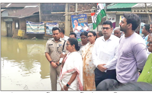
ঘাটালে বন্যা কবলিত এলাকা পরিদর্শনে মুখ্যমন্ত্রী। সঙ্গে দেব।