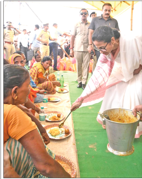
আরামবাগের ত্রাণ শিবিরে নিজের হাতে খাবার পরিবেশন করছেন মুখ্যমন্ত্রী মমতা বন্দ্যোপাধ্যায়।

নেমে পরিস্থিতি খতিয়ে দেখেন। তিনি বলেন, এই বছর একটু আগেই বন্যার পরিস্থিতি তৈরি হয়েছে পশ্চিমবঙ্গে। যার ফলে ঘাটালের বেশ কিছু জায়গা বন্যা কবলিত হয়েছে। ডিভিসি না জানিয়ে জল ছেড়ে দেওয়ায় ঘাটালে বন্যা পরিস্থিতি তৈরি হচ্ছে বলে অভিযোগ মুখ্যমন্ত্রীর। মমতা বন্দ্যোপাধ্যায় জানান, ছাব্বিশের বিধানসভা নির্বাচন হয়ে গেলে আমরা বড় বড় জলাধার তৈরি করব। ডিভিসি হটাৎ করে জল ছেড়ে দিলে সেখানে জল সঞ্চিত করে রাখা হবে, পরে পরিকল্পনা মাফিক জল নিকাশির ব্যবস্থা করব। পাশাপাশি তিনি এসআইআর ইস্যুতে কেন্দ্রীয় সরকারকে কড়া ভাষায় আক্রমণ করেন। নির্বাচন কমিশনকে ঝঁশিয়ারি দিয়ে জানান, যারা একবার ভোটার লিস্টে অন্তর্ভুক্ত হয়েছে তারা হটাৎ করে কেন বাদ পড়বে। প্রত্যেকটি ঘাটালবাসীকে বলে যাচ্ছে, আপনারা ভোটার লিস্টে সবাই নতুন করে নাম তুলবেন। কেন্দ্রীয় সরকার চরমস্ত পড়বে। প্রত্যেকটি ঘাটালবাসীকে বলে যাচ্ছে, আপনারা ভোটার লিস্টে সবাই নতুন করে নাম তুলবেন। কেন্দ্রীয় সরকার চরমস্ত করছে, এস আই আর-এর নামে এনআরসি করার চেষ্টা হচ্ছে। সেই সঙ্গে তিনি দাবি করেন, ১০০ দিনের কাজের টাকা কেন্দ্রীয় সরকার দীর্ঘদিন ধরে আটকে রেখেছে। যার ফলে নদী-নালা সংস্কার করতেও সমস্যার সম্মুখীন হতে হচ্ছে রাজ্য সরকারকে।