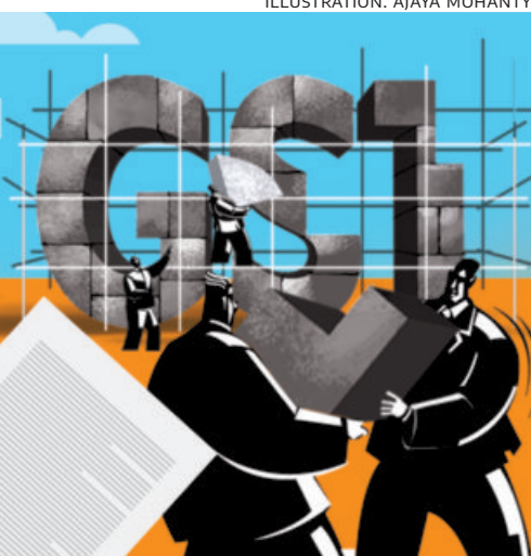
ABHISHEK ANAND, VARUN BALOTIA, PRAVEEN RAVI, NAVNEERAJ SHARMA AND ARVIND SUBRAMANIAN

Today, the GST Council meets to undertake long-overdue reforms to rationalise the goods and services tax (GST), focusing on eliminating two high-rate slabs (12 and 28 per cent). This article visually summarises, in two tables, how not-simple the GST is, which leads to serious but under-recognised problems of arbitrary and coercive implementation, evasion, mis-classification, corruption, and adversely affects the ease of doing business. Table 1 shows that today, contrary to popular belief, there are almost 45 distinct rates compared to the standard five slabs. Most of the multiplicity comes from the cesses, but some also from non-standard slabs. Table 2 identifies four kinds of complexity: Duty inversion, arbitrary classification, value-based rates, and end-use and input-based rates, each with its distinctive pathologies. Just to convey a sense of the anomalies to rectify, consider two: In Table 1, look at the boondoggle for buyers of personal yachts and jets. In Table 2, look at the paratha-pizza-pappadom-popcorn puzzles! Author affiliations: Madras Institute for Development Studies, Insignia, Centre for Effective Governance of Indian States, private consultant, and Peterson Institute for International Economics, respectively