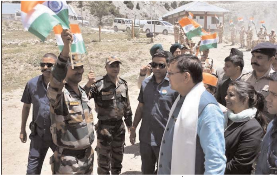
सेना के जवानों के साथ सीएम धामी हर घर तिरंगा कार्यक्रम के दौरान।

वीर अर्जुन संवाददाता देहरादून। मुख्यमंत्री पुष्कर सिंह धामी ने बुधवार को सीमांत गांव मलारी में भारतीय सेना, आईटीबीपी (हिमवीर), सीमांत सड़क संगठन (शिवालिक) के जवानों और द्वितीय रक्षा पंक्ति के रूप में सीमांत गांव के निवासियों के साथ हर घर तिरंगा कार्यक्रम में प्रतिभाग किया और सभी का हौसला बढ़ाते हुए आजादी के अमृत महोत्सव को बधाई दी। हर घर तिरंगा कार्यक्रम को लेकर सेना के जवानों और सीमांत गांवों के निवासियों में जबरदस्त उत्साह और उमंग दिखा। सीमांत गांव मलारी में आयोजित हर घर तिरंगा कार्यक्रम में सेना के जवानों के साथ ही सीमांत गांव कैलाशपुर, महरगांव, कोषा, द्रोणागिरी, नीति, बांम्पा, गमशाली, फरकिया, श्लेम, जुम्मा, कागा, गरपक, मलारी के लोगों ने हर्षोल्लास से प्रतिभाग लिया। मुख्यमंत्री पुष्कर सिंह धामी ने कहा कि आजादी का अमृत