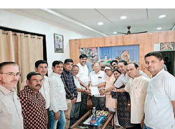
इस कारण श्री महावीर सागर

का भी विकास नहीं हो पा रहा है तथा इस क्षेत्र का पर्यटन केन्द्र के रूप में उन्नयन पचीसी वर्षों से स्थगन ही बना हुआ है। अतएव वाहन जा पाएँ ऐसे मार्ग का निर्माण एकदम आवश्यक है। सड़क निर्माण होने पर ग्रामीणों तथा समाजजनों का सुविधा से आना जाना होगा। विधायक श्री