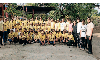
शामगढ़ में युवाओं की शक्ति और उत्साह का प्रदर्शन।