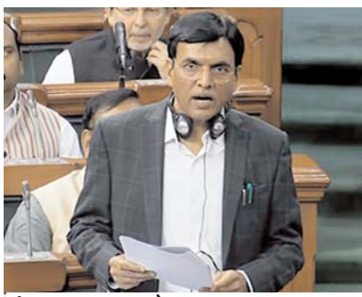
केंद्रीय स्वास्थ्य और परिवार कल्याण मंत्री मनसुख मांडविया लोकसभा को संबोधित करते हुए।

मांडविया ने उत्तर में कहा कि प्रधानमंत्री नरेंद्र मोदी ने 2018 में आयुष्मान भारत हेल्थ एंड वेलनेस सेंटर योजना शुरू की थी और आज देश में 1,54,000 ऐसे केंद्र खोले जा चुके हैं। उन्होंने कहा कि इन केंद्रों का उद्देश्य लोगों को योग, पोषण, स्क्रीनिंग आदि की सुविधा प्रदान कर रोगों से मुक्त करना है। स्वास्थ्य मंत्री ने