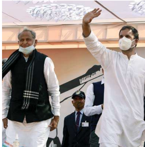
कांग्रेस नेता राहुल गांधी पदमपुर में किसान महापंचायत में उपस्थित लोगों का अभिवादन करते हुए। साथ में हैं मुख्यमंत्री अशोक गहलोत

कांग्रेस नेता ने कहा कि देश का किसान और मजदूर आने वाले दिनों में प्रधानमंत्री को अपनी शक्ति दिखाने चाहिए। इसके साथ ही उन्होंने कहा कि कृषि कानूनों के खिलाफ आंदोलन कर रहे किसानों के साथ पूरा हिंदुस्तान खड़ा है। उन्होंने कहा कि यह हिंदुस्तान का आंदोलन है बस किसान ने अंधेरे में दिया जलाया है। प्रधानमंत्री मोदी आंदोलनरत किसानों को तीन विकल्प देने की बात