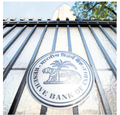
RBI says investments in shadow banks from FATF non-compliant jurisdictions shall not be treated on a par with that from compliant jurisdictions.

According to the new rules, fresh investors from non-compliant jurisdictions should hold less than the threshold of 20% of the voting power, including