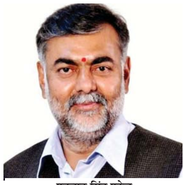
प्रह्लाद सिंह पटेल

वीर अर्जुन संवाददाता नई दिल्ली। केंद्र सरकार ने मंगलवार को बताया कि जम्मू एवं कश्मीर से अनुच्छेद 370 को हटाए जाने के बाद इस संघ शासित क्षेत्र में पर्यटकों की संख्या में गिरावट दर्ज की गई और इसका सबसे अधिक असर कश्मीर घाटी में हुआ है।