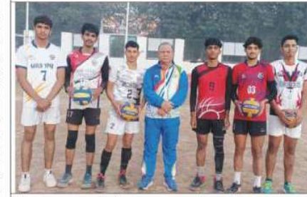
سے وابستہ حلقوں نے قانون پیشین کے اس قدم کو بے حد سراہا اور اس سے صدی طبعی پونچھ کے نوجوانوں کے لیے ایک روشن کے میدان میں جنوں کشمیر کا نام مزید بلند ہوگا۔