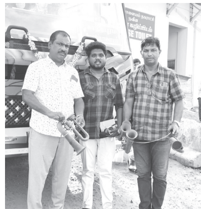
கட்டுப்படுத்தும் வகையிலும், ஏர் ஹாரன்களை அகற்றும் வகையிலும்,

மேட்டுப்பாளையம், மே 30- கோவை மாவட்டம் மேட்டுப்பாளையத்தில் பேருந்துகளில் தமிழக அரசால் தடை செய்யப்பட்ட ஏர் ஹாரன்கள் பறிமுதல் செய்யப்பட்டு, ஒரு லட்சத்து 10 ஆயிரம் அபராதம் விதிக்கப்பட்டது. மேட்டுப்பாளையம் பகுதியில் பேருந்துகளில் அதிக ஒலி எழுப்பும் ஏர் ஹாரன் பயன்படுத்துவதால் பொதுமக்களுக்கும் பயணிகளுக்கும் மிகுந்த சங்கடத்தை ஏற்படுத்துகிறது. பொதுமக்கள் அளித்த புகார்களின் பேரில், மேட்டுப்பாளையம் சட்டமன்ற உறுப்பினர் கனீஸ் ஆனந்த் ஆலோசனையின் பேரில், பேருந்துகள் அதிக வேகமாக செல்வதால் விபத்துக்கள் ஏற்படுவதால் அதை