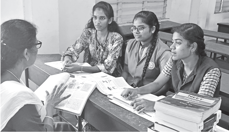
இந்நிலை மருத்துவ படிப்புகளுக்கான நீட் மறு நுழைவுத்தேர்வு வரும் ஜூன் 21ம் தேதி நடைபெறுவதை முன்னிட்டு கோவை ராஜலக்ஷ்மி உள் துணி வணிகர் சங்க பெண்கள் மேல்நிலைப்பள்ளியில் இலவச பயிற்சி வகுப்பு இன்று துவங்கியது.