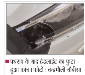
पथराव के बाद हैडलाइट का फुटा हुआ कांच।

कार की हैडलाइट टूटी, देवल के निकट की हुई घटना डूंगरपुर(पुकार)। जिले में पथराव की घटना थमने का नाम नहीं ले रही है। सड़कों पर कुछ हद तक तो अब कार्यवाहीयों के बाद अपराधियों में भय का माहौल बना हुआ है, लेकिन एक बार फिर बुधवार रात्री को