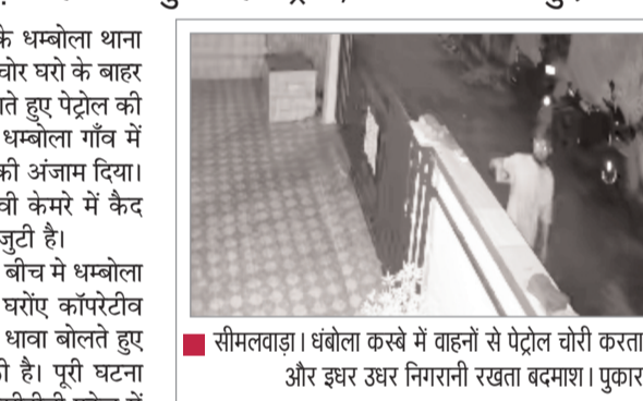
सीमलवाड़ा। धंबोला कस्बे में वाहनों से पेट्रोल चोरी करता और इधर उधर निगरानी रखता बदमाश। पुकार

सीमलवाड़ा(पुकार)। जिले के धम्बोला थाना क्षेत्र में इन दोनों पेट्रोल चोर सक्रिय है। चोर घरों के बाहर और अंदर खड़े वाहनों को निशाना बनाते हुए पेट्रोल की चोरी कर रहे हैं। बुधवार रात को धम्बोला गांव में कई वाहनों से पेट्रोल चुराने की घटना की अंजाम दिया। इधर पेट्रोल चोरी की वारदात सीसीटीवी कैमरे में कैद हो गई है। पुलिस मामले की जांच में जुटी है। बुधवार रात करीब 3 से 4 बजे के बीच में धम्बोला गांव में महादेव जी मार्ग के पास के चारोंए कॉर्पोरेट बैंक के पास के घरों में पेट्रोल चोरों ने धावा बोलते हुए दुपहिया वाहनों से पेट्रोल की चोरी की है। पूरी घटना सीसी टीवी कैमरे में कैद हो गई है। सीसीटीवी फुटेज में 2 युवक दिखाई दे रहे हैं, जो गली में खड़े दुपहिया वाहनों से पेट्रोल निकालते दिखाई दे रहे हैं। साथ ही घर की दीवार को फटते हुए दिखाई दे रहे हैं। चोरों ने धम्बोला कस्बे में लगभग 12 बाइकों से पेट्रोल चोरी की घटना