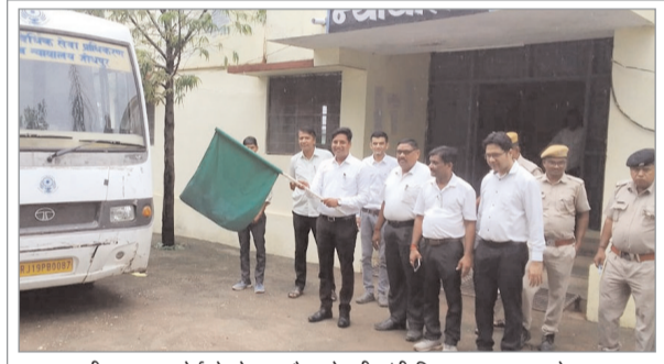
सीमलवाड़ा। कोर्ट से मोबाइल वैन को हरी झंडी दिखाकर रवाना करते हुए। पुकार

पीठ, बाकड़ा, दरियाटी, कुआं, चिखली होते हुए अपने मुख्य स्थान की ओर प्रस्थान करेगी। ताकि विधीक सेवा का अधिक से अधिक प्रचार प्रसार हो सके और कोई भी न्याय से वंचित न रहे।