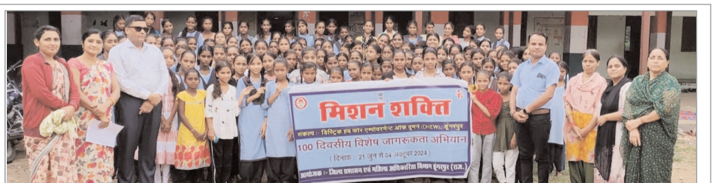
विशेष जागरूकता अभियान शिविर के दौरान उपस्थित बालिकाएँ एवं परामर्शदाता।

● लागू हुई लाडो प्रोत्साहन योजना ● जागरूकता अभियान के तहत शिविर में बेटियों को दी जानकारी