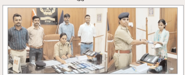
पुलिस टीम के द्वारा एकत्र किये गये मोबाइल एवं मालिकों को मोबाइल सुपुर्द करती एसपी।

मोबाइल फोन को अलग-अलग जगहों से बरामद किया गया। इन बरामद मोबाइल फोन के मालिकों ने अलग-अलग थानों में शिकायत दर्ज करवाई थी। इसी आधार पर इन लोगों को मोबाइल सुपुर्द किए हैं। उन्होंने बताया की विशेष अभियान के तहत करीब 10 लाख रुपए के 32 मोबाइल बरामद किए