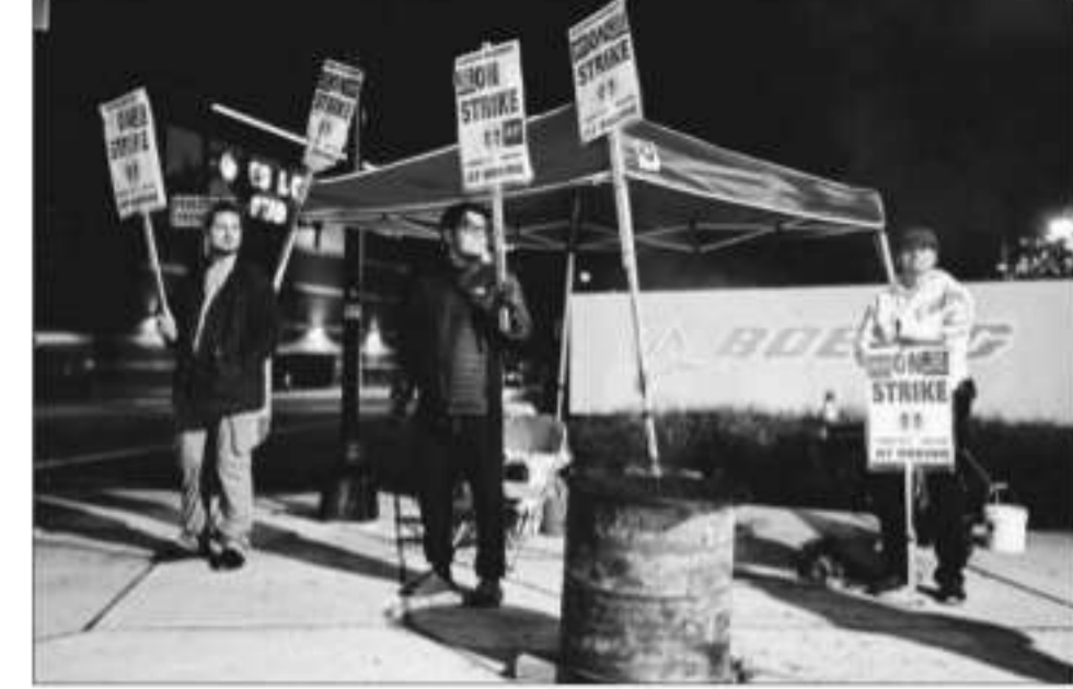
Boeing employees work the picket line on Wednesday, outside the firm's facilities in Renton, Washington

ment on the vote, which was a setback for the company's new chief executive, Kelly Ortberg, who is trying to restore its reputation and business with a strategy he described in detail earlier on Wednesday. In remarks to workers and investors, Ortberg said Boeing needed to undergo "fundamental culture change" to stabilise the business and to improve execution.