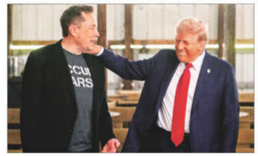
Tim Walz, Kamala Harris's running mate, referred Elon Musk this week as Donald Trump's true "running mate"