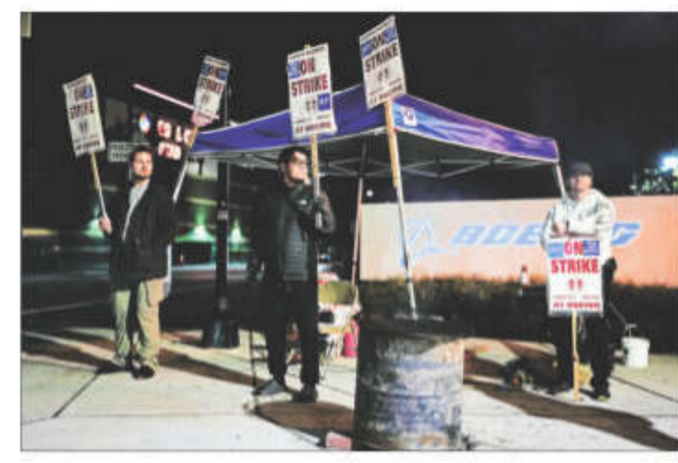
Boeing employees work the picket line on Wednesday, outside the firm's facilities in Renton, Washington