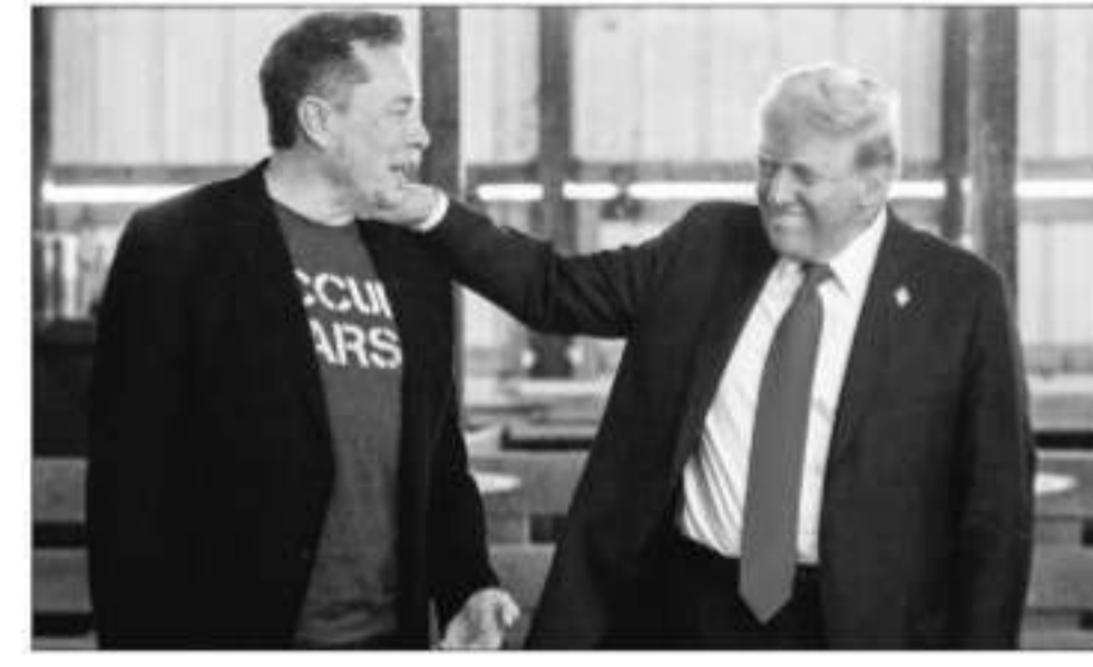
Tim Walz, Kamala Harris's running mate, referred Elon Musk this week as Donald Trump's true "running mate"