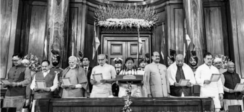
President Droupadi Murmu, Vice President CP Radhakrishnan, Prime Minister Narendra Modi and other leaders during the Constitution Day celebrations at Central Hall of Samvidhan Sadan in New Delhi on Wednesday