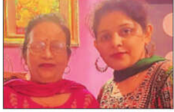
घरेलू कलह से परेशान था आरोपी। वारदात के बाद बच्चों को लेकर फरार आरोपी को पुलिस ने किया गिरफ्तार।